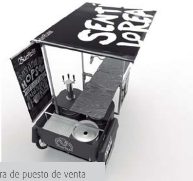
Figura 4. Estructura de puesto de venta