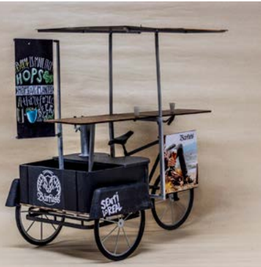
Figura 1. Triciclo de servicio

La hipótesis de producción fue desarrollada pensando en tecnologías acordes a la ciudad de La Plata. Tanto la estructura como las carcazas de PRFV se podrían poner en producción. Se deberían comprar piezas ya fabricadas estándar, como la transmisión/piñones, las ruedas rodado 26 y la perfilaría de aluminio para poder desplegar la gráfica, la barra y el techo. Se estima que en la ciudad existen más de doscientos microproductores de cerveza que quieren crecer y este producto podría ser una forma de generar una identidad [Figuras 4, 5 y 6].