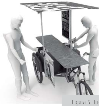
Figura 5. Triciclo de servicio