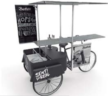
Figura 2. Vista lateral