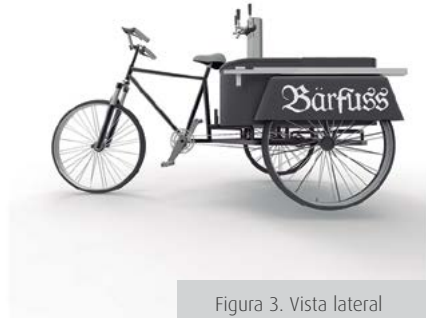
Figura 3. Vista lateral