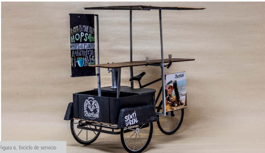
Figura 6. Triciclo de servicio