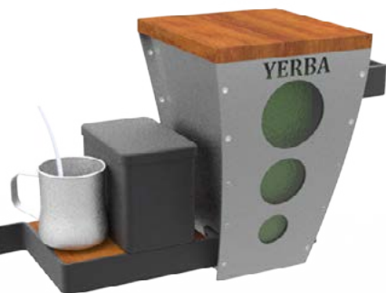
Figura 1. Perspectiva superior