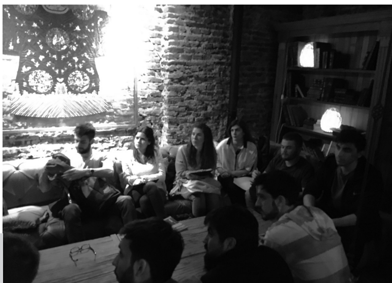
Figura 3. Grupo de alumnos entrevistando al dueño del bar

Luego de desarrollar sus trabajos con el soporte de las tutorías de la cátedra y una vez realizados los ajustes que surgían de las correcciones, los alumnos hicieron una presentación pública de sus proyectos ante el resto de los compañeros, los docentes de la cátedra y los comitentes. La temática a desarrollar por los estudiantes consistió en diseñar un objeto recordatorio destinado a los clientes y a los visitantes de Nápoles. Algunos de los productos que técnica, económica y comercialmente fueron analizados por los estudiantes, se pueden observar en las Figura 4.