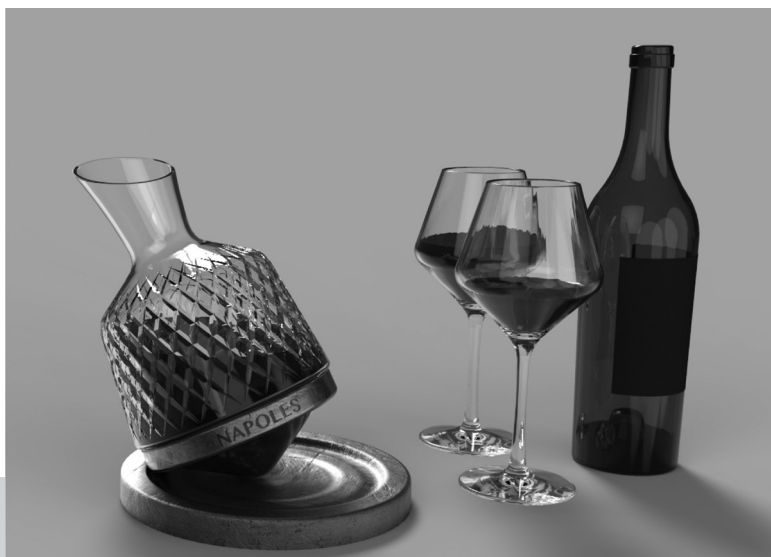
Figura 4. Decantador de Vino

Luego de desarrollar sus trabajos con el soporte de las tutorías de la cátedra y una vez realizados los ajustes que surgían de las correcciones, los alumnos hicieron una presentación pública de sus proyectos ante el resto de los compañeros, los docentes de la cátedra y los comitentes. La temática a desarrollar por los estudiantes consistió en diseñar un objeto recordatorio destinado a los clientes y a los visitantes de Nápoles. Algunos de los productos que técnica, económica y comercialmente fueron analizados por los estudiantes, se pueden observar en las Figura 4.