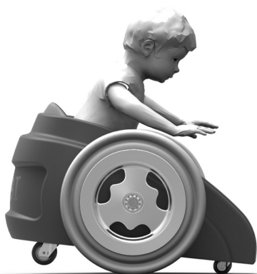
Inclinación hacia adelante