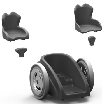
Asiento de silicona intercambiable