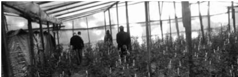
Figuras 16 a 19. Asesoramiento al Cordón Productivo de La Plata