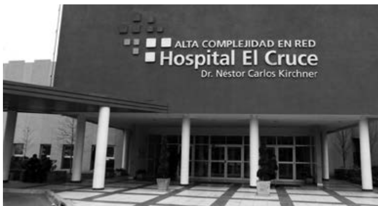
Figura 1. Frente del Hospital El Cruce Dr. Néstor Carlos Kirchner

La firma del convenio con este hospital ubicado en Florencio Varela permitirá que un equipo de Diseño Industrial, formado por docentes y alumnos, lleve a cabo el ejercicio profesional en nuevos sectores de la biotecnología y de la materialidad tecnológica y desarrolle un centro de prototipado rápido para dar soluciones profesionales a la medicina. Además, se proyecta la creación de una gliptoteca (impresiones 3D de cardiopatías congénitas), la adaptación de estructuras hospitalarias ergonómicas (para pacientes y trabajadores) que solucionen inconvenientes ocultos en la práctica diaria dentro del hospital, el mantenimiento de Hospital de Simulación y la creación de simuladores de baja fidelidad [Figura 1].