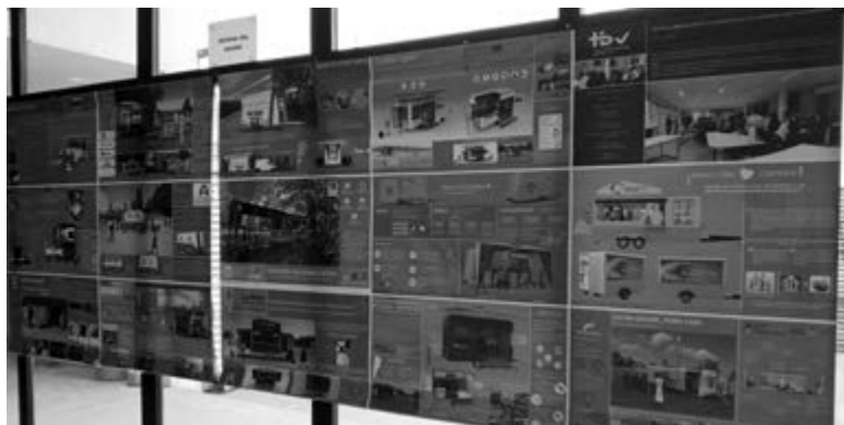
Figuras 13 a 15. Muestra de dibujos de la Cátedra de Dibujo 1 y 2