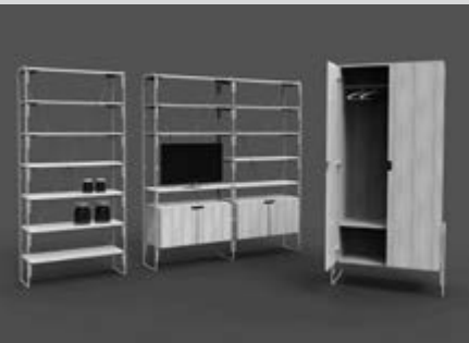
División de aéreas de agua