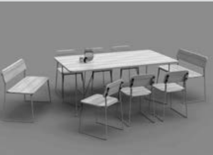
Destilador solar tipo caseta