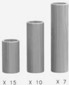
Longitudes de los cilindros de bambú