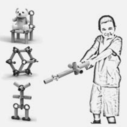
Ejemplos de construcciones