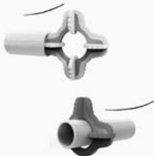
Piezas y encastre

Nodo tiene como objetivo atender, mediante el juego, a la problemática de la falta de atención de los niños con dificultades en la comunicación, favoreciendo la concentración, el descubrimiento y la exploración con sus compañeros. De este modo, se incentiva la estimulación del desarrollo lógico-conceptual para que empleen su creatividad para resolver problemas, como medir magnitudes, evaluar el peso de objetos, etcétera.