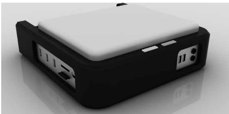
Módulo de edición: vista frontal-lateral