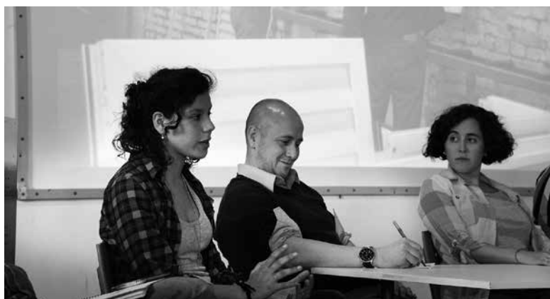
Diseñadores en la exposición