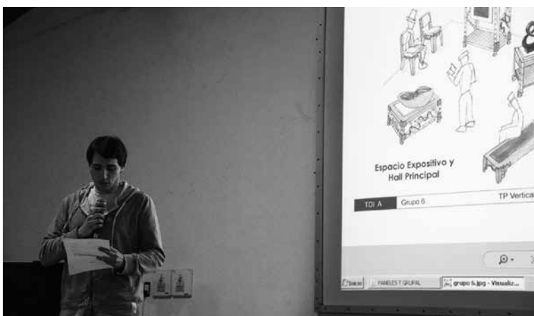
Equipo de alumnos mostrando su proyecto