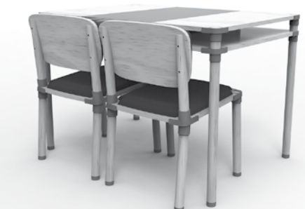
Sillas y mesa del comedor ▲