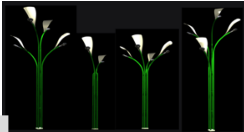
Figura 2. Evocación de la naturaleza

El producto puede ser adaptado para otros ámbitos como pasajes peatonales, plazas, parques, barrios cerrados, clubes, etcétera. Por medio del uso del mismo poste base y cambiando y/o agregando piezas se generan luminarias peatonales dobles, triples y cuádruples con forma radial que varían conforme a su altura. Se generan así diversas morfologías amigables que evocan a finas flores en diferentes elevaciones, emulando obras de arte urbano [Figura 2].