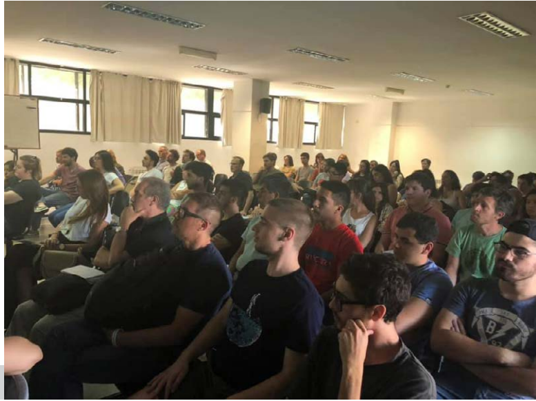
Figura 15. Vista del público presente