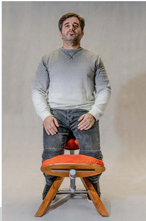
Figura 4. Sentado en posición balans

La altura de las superficies de apoyo es más elevada que en una silla tradicional para adecuarse a las superficies de trabajo que, por lo general, son más altas que una mesa hogareña. También, al momento de determinar la forma y la disposición de los distintos componentes, se tuvo en cuenta el aprovechamiento de material, por lo que no se percibe excesivo desperdicio. Por último, el marco de la hipótesis de producción se enfoca totalmente en la industria nacional, por lo cual se eligieron maderas de forestación nacionales, como el guatambú, empleado en listones y multilaminado de 3 mm, el trabajo de curvado y mecanizado de acero 1045 en caños y barras, y vínculos fabricados en fundición de aluminio, mecanizados y ensamblados con tornillos. De acuerdo con esto, ponemos en pie y damos forma a nuestra silla ergonómica Minerva [Figura 4].