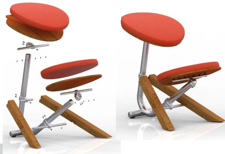
Figura 3. Perspectiva explotada: despiece que permite ver componentes y cómo se ensamblan

Los aspectos tecnoproductivos de la silla se resuelven sobre la base de materiales y terminaciones robustas necesarias en estos espacios de trabajo, el menor peso posible para favorecer el traslado constante a los distintos sectores de los talleres y la menor cantidad de componentes involucrados en el armado para lograr un equilibrio entre durabilidad y ensamblaje [Figura 3].