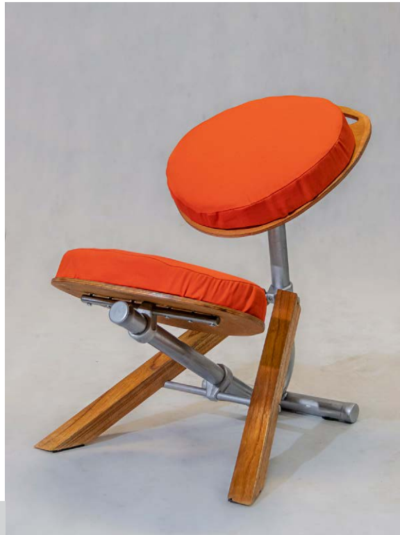
Figura 5. Vista general

El mayor desafío fue realizar todas las tareas posteriores al cierre de la idea de la forma más eficiente posible sin olvidarnos que en la teoría se puede plantear algo, pero que es la práctica la que termina de darle forma. No importa cuán buena parezca una idea o un proyecto si después no pueden conseguirse materiales, los costos de ejecución exceden el presupuesto o si no se cumplen los tiempos de las distintas etapas. Creemos que una idea, un proyecto o un diseño desde el punto de vista creativo, metodológico y conceptual puede ser espléndido, pero son esos factores los determinados por «la calle», la experiencia y el contacto con el ámbito productivo real lo que lo hace verdaderamente realizable.