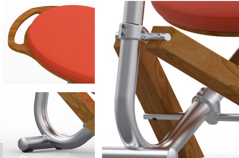
Figura 2. Detalles constructivos

Los aspectos tecnoproductivos de la silla se resuelven sobre la base de materiales y terminaciones robustas necesarias en estos espacios de trabajo, el menor peso posible para favorecer el traslado constante a los distintos sectores de los talleres y la menor cantidad de componentes involucrados en el armado para lograr un equilibrio entre durabilidad y ensamblaje [Figura 3].