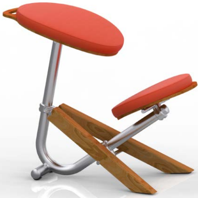
Figura 1. Vista general de la silla ergonómica Minerva