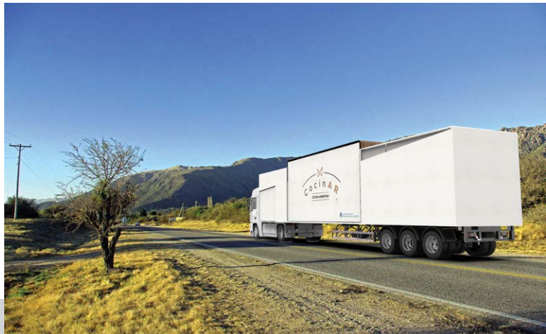
Figura 3. Situación de transporte

El proyecto se desarrolló a partir de la idea conceptual de la comida como medio de interacción social y cultural, por lo que se partió de un espacio que se expande en dos direcciones, lo que da lugar al sitio en donde transcurren las relaciones entre partes, logrando, de esta manera, enfatizar un punto de interacción. Paralelamente, se buscó representar la convergencia de las distintas regiones dentro de un mismo servicio, por lo que se optó por emplear como recurso la superposición de planos y la utilización de diversas texturas y terminaciones superficiales, entre las que se encuentran maderas, piedras y textiles. Se trata de un servicio que tiene la capacidad de implantarse en el lugar de manera itinerante, logrando romper con la linealidad que se requiere para su situación de transporte [Figura 3].