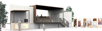
Figura 1. Despliegue del servicio