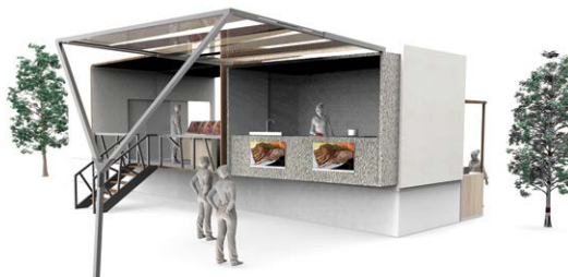
Figura 2. Escenario para clases

Se propone un comedor cultural itinerante que pueda ser trasladado sobre ruedas para recorrer distintos puntos del país y ofrecer temáticas regionales que varíen de manera mensual, con el objetivo de despertar la curiosidad de los comensales a través de la degustación de diversos platos típicos. El mismo brinda la posibilidad de que veinticinco personas, de manera gratuita, puedan disfrutar durante cuarenta minutos de las sensaciones ocasionadas por los sabores y por un conjunto de imágenes auditivas acorde a la región en cuestión [Figura 1]. Una vez finalizada la experiencia, los visitantes podrán aprender las recetas típicas en el exterior, con clases brindadas por cocineros especializados [Figura 2].