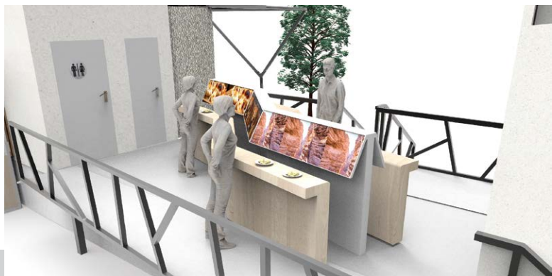
Figura 4. Área de degustación

A través de este anteproyecto se busca lograr que todas aquellas personas que vivan la experiencia puedan abstraerse momentáneamente del entorno en el que se encuentran, dando lugar a que se genere un modelo de interacción dinámica entre los visitantes y las regiones de las cuales se brinda información [Figura 4].