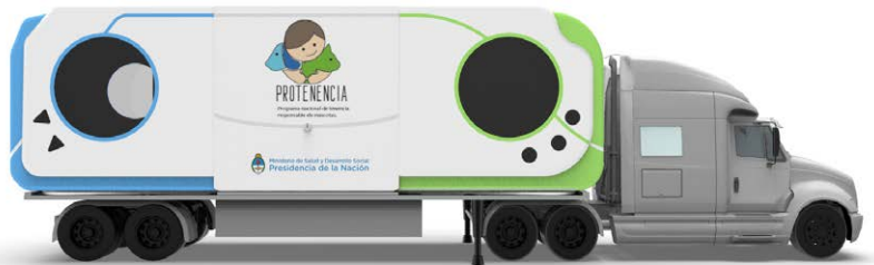
Figura 2. Exterior del quirófano móvil veterinario

y se permite un tránsito organizado. Posee zonas bien definidas, tanto en su interior como en el exterior, que colaboran al orden, la limpieza y el recorrido del personal y de pacientes. Además desde sus rasgos formales y de la terminación superficial, se logra un reconocimiento a simple vista de cada sector, tales como ingresos, salidas, salas de vacunación y quirófano, salas de espera y zona de adiestramiento [Figura 2].