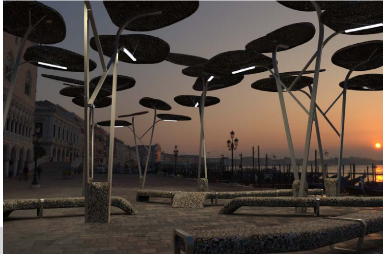
Figura 2. Banco y pérgola. Perspectiva lateral

productos busca despertar la curiosidad, a la vez que informa sobre los procesos y los productos que ayudaron a crear estos objetos, demostrando la importancia de la separación de residuos, así como el potencial de estos como materia prima.