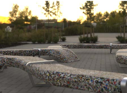
Figura 1. Banco. Perspectiva lateral