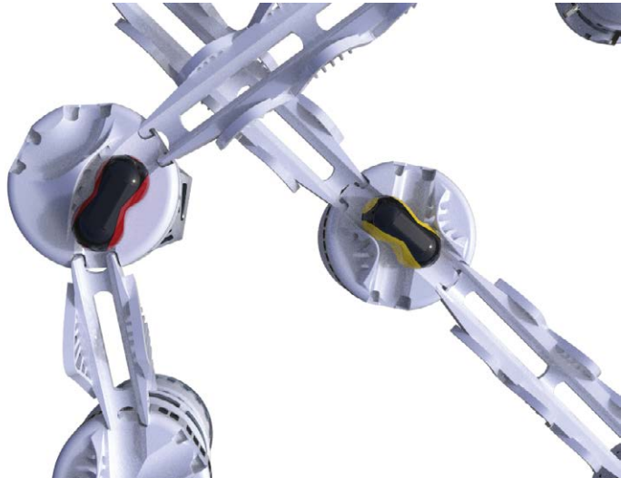
Figura 3. Detalle del tablero: cruces y curvas

Las leyes de la física afectan la ruta que el vehículo toma, que posee curvas y cruces, por lo que los niños deberán experimentar con alturas y ángulos para controlar la velocidad del mismo [Figura 3].