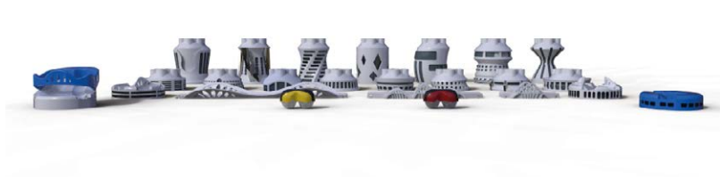
Figura 4. Vista de puentes, edificios y vehículos

Además de presentar un juego reglado y controlado, Biopolis permite desarrollar la imaginación del niño a través de una construcción abierta, diseñando su propia metrópolis en cada jugada y experimentando así con la gravedad. Los puentes y los edificios están impresos en 3D. Cada modelado tiene características particulares por lo que con cada impresión se pueden aprender diferentes virtudes de esta tecnología. Los vehículos, para rodar, cuentan cada uno con dos canicas estándar que se encastran a presión en la carcasa impresa en 3D [Figura 4].