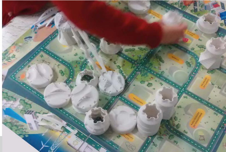
Figura 5. Sesión de comprobación

Gracias al esfuerzo de los docentes hemos podido llevar a cabo una sesión de comprobación, lo que nos permitió identificar virtudes y desventajas para continuar con el desarrollo de nuestro juego [Figura 5].