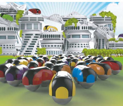
Figura 1. Presentación de Biopolis

Facultad de Artes. Universidad Nacional de La Plata La Plata. Buenos Aires. Argentina