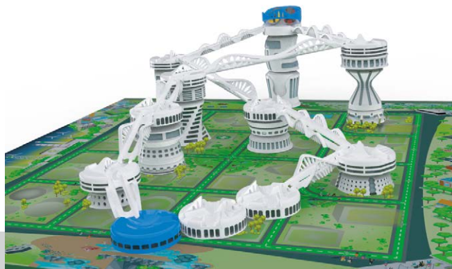
Figura 2. Vista del tablero

Es un juego para dos o más personas, por lo que cuenta con instrucciones para avanzar por etapas, paso a paso, a lo largo de un tablero [Figura 2] que indica a cada jugador dónde debe colocar su próximo edificio, siempre a partir de fines sustentables.