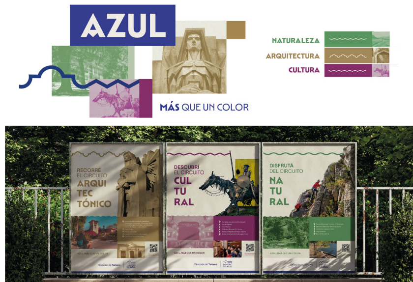
Figura 2. Campaña «Azul más que un color»

Bajo el lema «Azul, más que un color», la campaña destinada a la Dirección de Turismo del municipio tiene como objetivo dar a conocer y poner en valor el patrimonio local. Para ello, se desarrolló una identidad visual específica para esta área, que organiza la oferta turística en tres ejes temáticos: naturaleza, arquitectura y cultura [Figura 2]. Esta segmentación facilita la comunicación focalizada y eficiente de cada atractivo, potenciando el interés de diversos públicos.