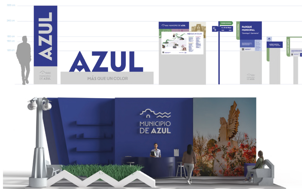
Figura 4. Entorno. Señalización pública y stand para feria

Además, el proyecto incorpora una perspectiva de sustentabilidad y participación ciudadana, promoviendo prácticas responsables en el uso del patrimonio y la naturaleza, e involucrando a la comunidad en la construcción de su propia identidad. Este enfoque colaborativo asegura que las acciones diseñadas respondan a las necesidades reales y fomenten un desarrollo armónico a largo plazo.