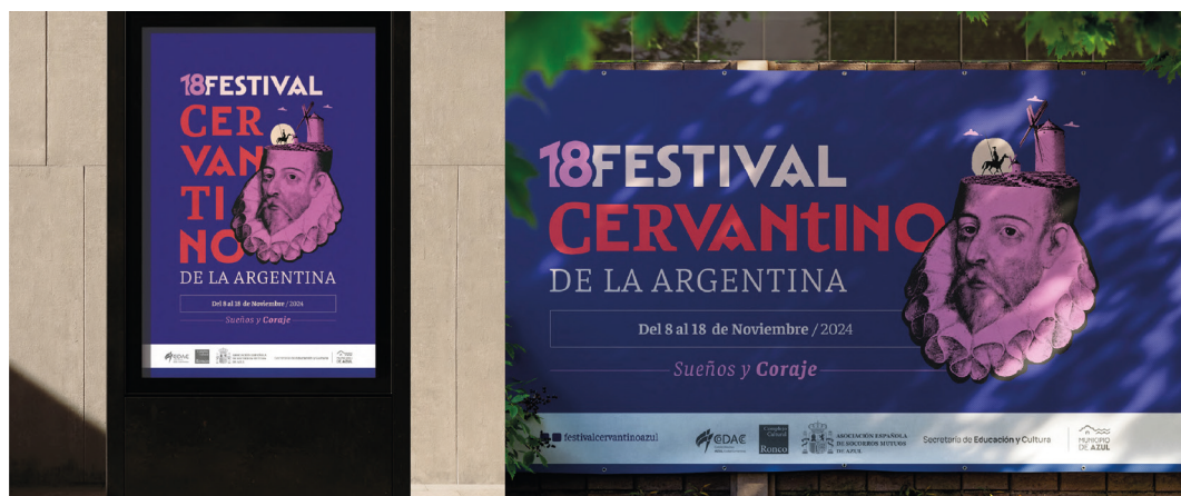
Figura 3. Campaña Evento promocional Festival Cervantino

A partir de esta base conceptual, se diseñaron diversas piezas gráficas y comunicacionales orientadas a la difusión de la campaña y sus objetivos, dirigidas tanto al público local como a los visitantes [Figura 3]. Asimismo, se implementan otras campañas destinadas a reordenar la imagen visual del municipio, garantizando que sea integral y coherente con el trabajo visual previamente desarrollado.