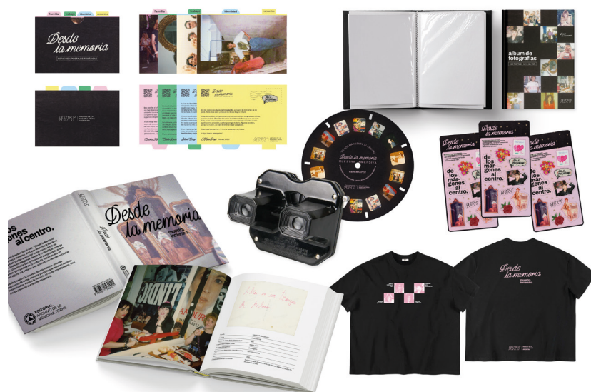
Figura 4. Algunas de las piezas gráficas y productos del proyecto

1. Todo el material fotográfico utilizado es pertenencia del Archivo de la Memoria Trans Argentina. Su uso en este proyecto responde a fines educativos y de difusión cultural sin uso comercial.