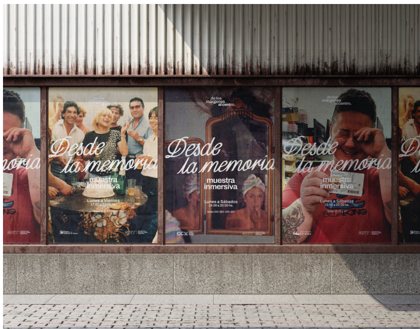
Figura 3. Afiches para campaña en vía pública 1

Como complemento, se propone una línea de productos que funcionen como extensión tangible de la experiencia: merchandising , objetos editoriales y piezas gráficas que permitan al público llevarse una parte de la muestra, conectar con el AMT en la vida cotidiana y contribuir a su sostenibilidad económica [Figura 4]. Algunas de ellas son: una serie de postales basadas en testimonios del libro Kumas , producido por el AMT; un fanzine A6 desplegable que contiene información sobre qué es un archivo y por qué es importante que existan los archivos; un álbum de fotos para rellenar como se solían utilizar antes, con folios individuales y capacidad para cien fotos; el libro de la muestra con material inédito y contenido extra; un viewmaster con disco temático del AMT; planchas de stickers ; remeras y totebags . Todo el desarrollo gráfico se inspira en los propios modos de registro del archivo, que hacen presente una estética travesti popular, tierna y afectiva.