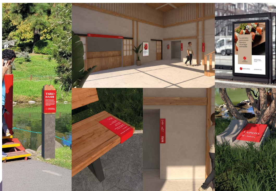
Figura 2. Foco de intervención N.º 2. Intervención en espacio físico

impresas constantemente; una serie de publicidades que aprovechen la parte exterior del perímetro del Jardín, emplazado en una ubicación estratégica con alta exposición, para seducir al público; y por último piezas de comunicación en los puntos cercanos de mayor concentración de personas en vía pública con un objetivo similar [Figura 2].