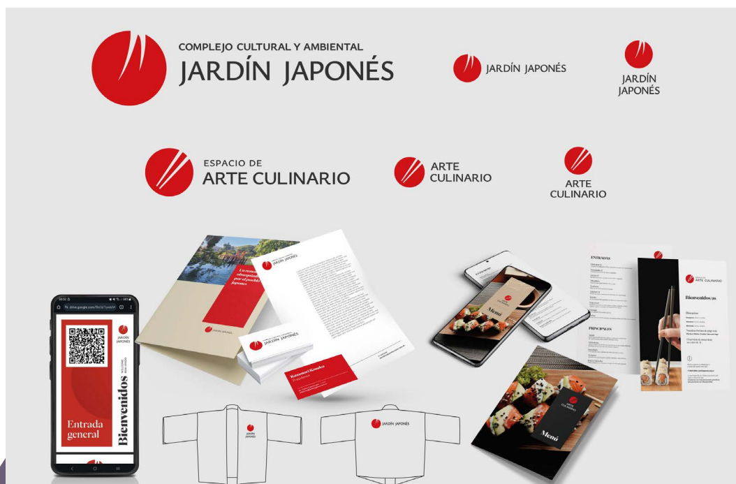
Figura 1. Foco de intervención N.º 1. Rediseño de identidad visual

El segundo foco de trabajo, el cual representó el mayor volumen en la propuesta, fue sobre el espacio físico y su interacción con él. Aquí se detectó una oportunidad desaprovechada de brindar al público más información en general, ya fuera de promoción, como de un tono informativo/educativo que enriqueciera la experiencia del paseo. Por lo que los esfuerzos se centraron en el planteo de una serie de identificadores que se posen junto a los hitos y monumentos del parque, que se integren armoniosamente con el paisaje y narren brevemente su historia y significado.