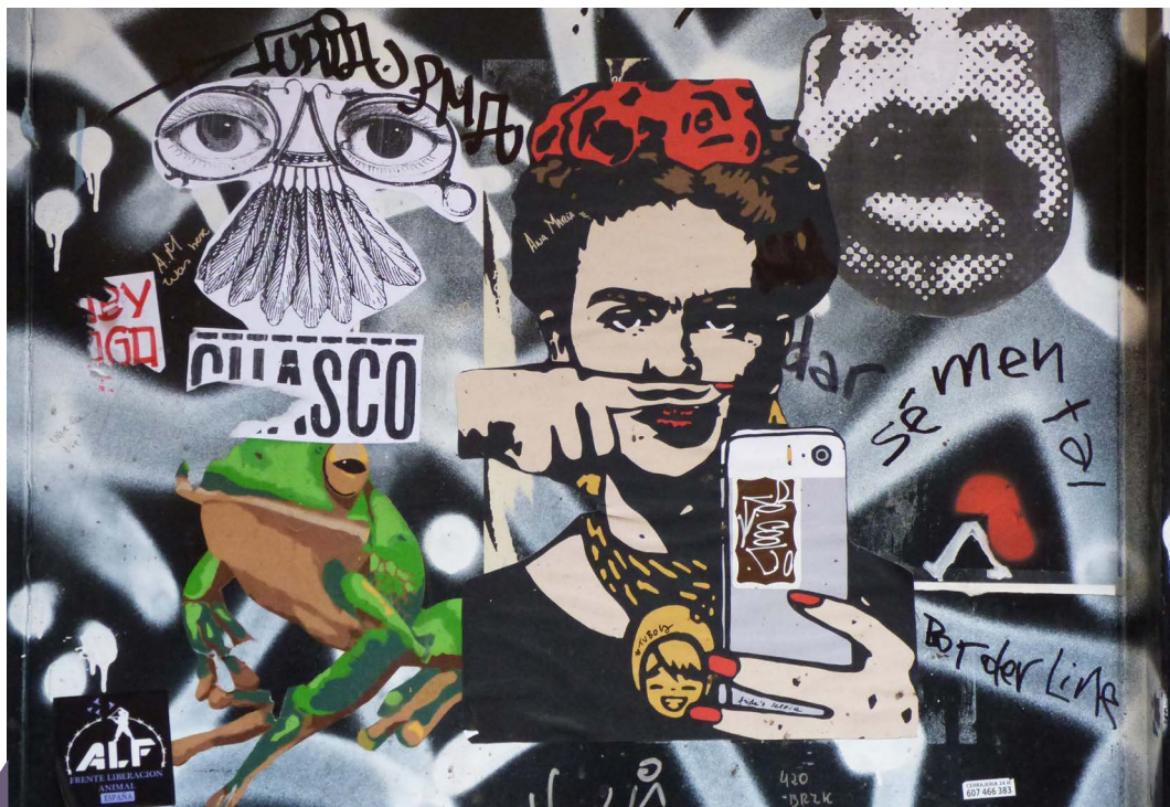
Figura 1. Autor desconocido, México. https://www.pickpik.com/frida-painting-urban-art-graffiti-collage-street-art-57728

El pastiche, según Frederic Jameson, es una forma imitativa que combina varios estilos y alusiones de diversas épocas y medios culturales en un collage estético único, pero, en última instancia, superficial y descontextualizado. Se distingue de la parodia por su falta de fundamento crítico (Jameson, 1991). Para Jameson, el pastiche en el posmodernismo actúa como un reflejo del vacío inherente al estilo contemporáneo; describe un mundo donde la superficialidad triunfa sobre el escrutinio y la crítica da paso a una exaltación de la superficie, sin profundidad. La fragmentación posmoderna —otra idea fundamental de la teoría de Jameson— toma forma al no tener ninguna narrativa o estructura unificadora, sino más bien yuxtaponer elementos heterogéneos en medio de este torbellino coalescente (Jameson, 1991). Esta fragmentación a nivel sociocultural se relaciona con el declive de las grandes narrativas o metanarrativas y la coexistencia de múltiples discursos fragmentados y subculturas [Figura 1].