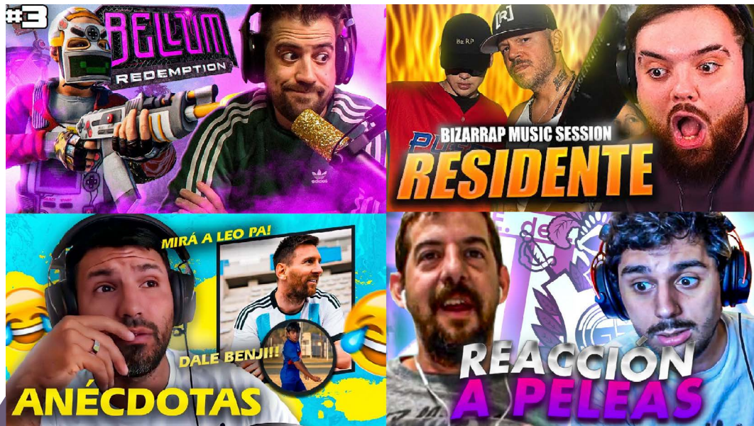
Figura 2. Composición de miniaturas de YouTube extraídas de los canales de Auronplay, Ibai, Kun Agüero y Luquitas Rodríguez (2023). Composición creada por Mariana Yalet.

Por ejemplo, los creadores de contenido pueden utilizar elementos recurrentes en sus miniaturas, como ellos mismos, invitados, personajes o estilos gráficos específicos, que se convierten en parte de una identidad visual reconocible —tal como ocurre en el diseño de posters para una misma saga de películas— permitiendo a los espectadores seguir una historia o tema a lo largo de diferentes videos y plataformas [Figura 2].