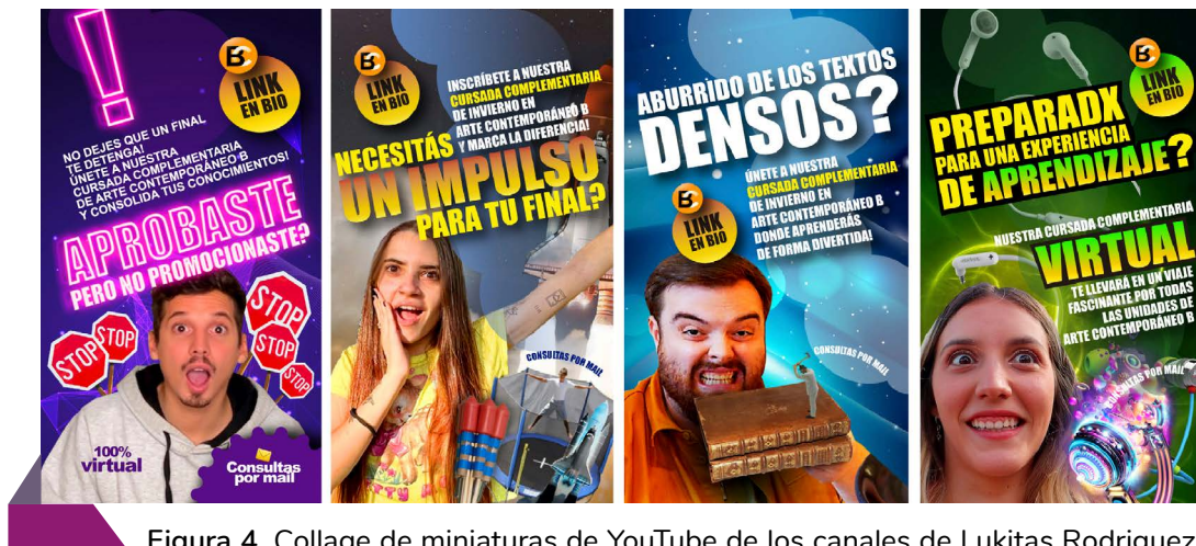
Figura 4. Collage de miniaturas de YouTube de los canales de Lukitas Rodriguez, Ibai, Bri Dominguez, Marti Benza (2023).

Técnicas de Collage: Las imágenes de publicidad de los streamers suelen utilizar técnicas de collage y superposición de elementos visuales. Estos elementos pueden incluir objetos, iconos, texto y otros elementos relacionados o no con el contenido del video. Esta técnica del collage y la superposición crea un efecto de pastiche visual, combinando diferentes elementos de manera inesperada y llamativa.