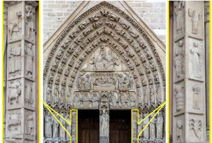
Figura 2. Portal de la Virgen. Fachada occidental. Notre-Dame de París (Uoaei1, 2015). Detalles del calendario (Desenclos, 2013)

Luego de una descripción del contexto histórico del edificio, así como del programa icónico al que los relieves pertenecen, centramos nuestra investigación en el tipo iconográfico del ciclo calendario medieval y trazamos su evolución desde sus antecedentes en la antigüedad hasta su consolidación en época medieval. Conocido como Las Labores de los Meses , en él cada mes es representado por un personaje en el cumplimiento real y activo de ocupaciones típicas de la vida rural, como actividades agrícolas, celebraciones, etcétera.