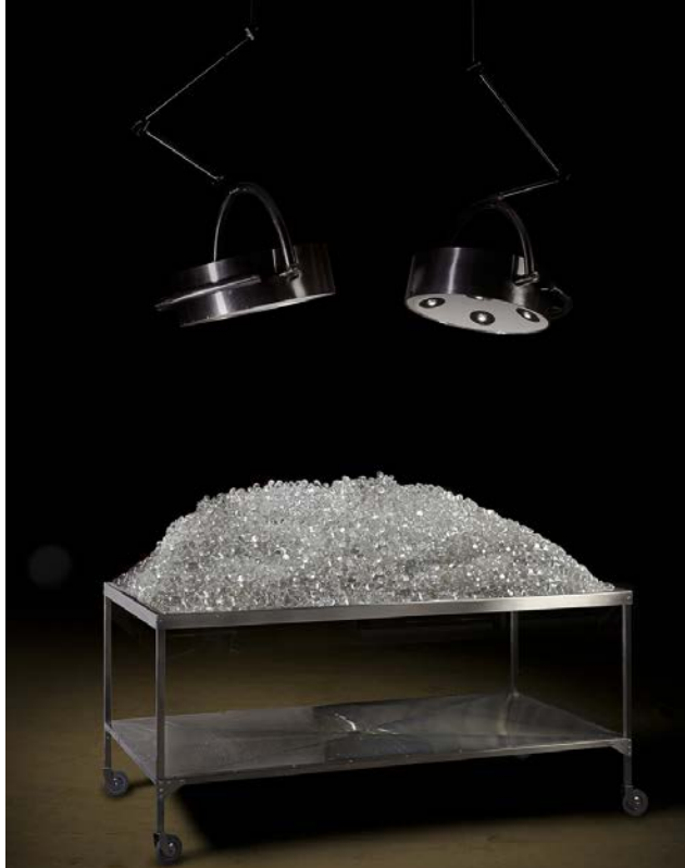
Figura 2. Rapsodia Inconclusa: Eva. La lluvia (2013), de Nicola Costantino 2

A partir de lo que ella rememora que su padre le contaba de niña, Costantino presenta a Eva como un personaje romántico que en su momento de gloria muere trágicamente. Al finalizar el recorrido, la última etapa, Eva. La lluvia [Figura 2], se aleja de la representación figurativa del cuerpo de Eva para sugerir una escena análoga a la de un quirófano o una morgue: una estructura de metal similar a una camilla sostiene cientos de hielos con forma de gotas. Por encima, las potentes luces de cirugía los iluminan directamente; los hielos se derriten y al gotear sobre la parte inferior, también de metal, generan un sonido que alude a la lluvia, aquella que oscureció la noche del 26 de julio de 1952. La lluvia, claro, se asemeja al llanto, al de grasitas y descamisados. Una imagen fría y melancólica, que interpela al espectador en sus recuerdos vívidos o contados sobre ese acontecer, sobre ese momento específico en el que Eva, más que nadie, alcanza otra dimensión, la de la inmortalidad. El hielo se derrite lentamente, como la lentitud del cáncer; la lluvia y las lágrimas cesan; Evita, permanece.