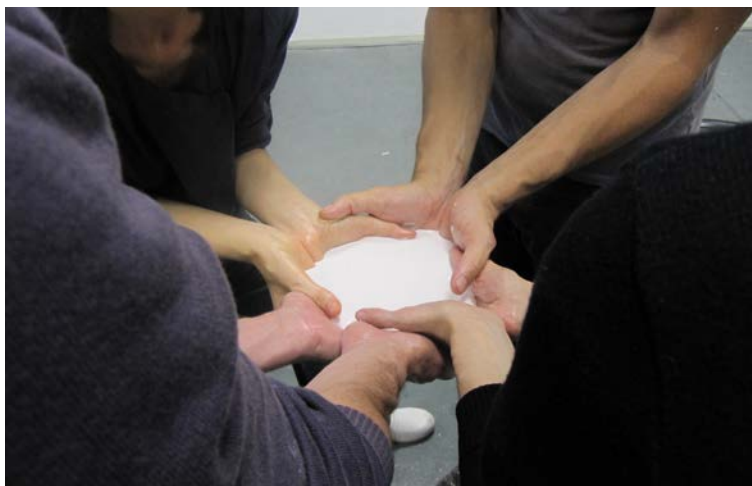
Figura 4. El aire entre los dos tiene forma de hueso (2014), de Jimena Croceri 4

también se metaforiza la unión: es que la analogía del yeso con lo óseo, en su textura y en su color, refuerza la idea de continuidad de los cuerpos por fuera de sí mismos, como si tuviéramos huesos externos que nos unieran a otros y otras.