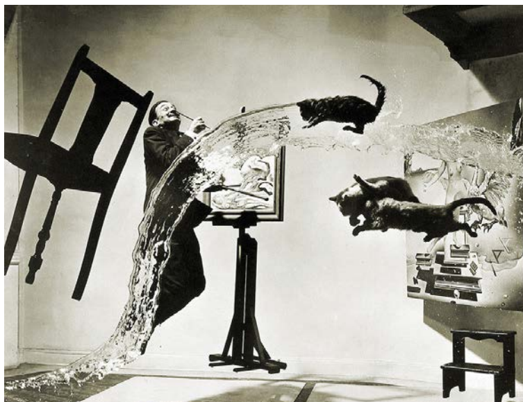
Figura 5. Dalí Atomicus (1948), de Philippe Halsman 5

énfasis en el tiempo, así como también la escala, el emplazamiento, el material o el medio de circulación de las mismas.