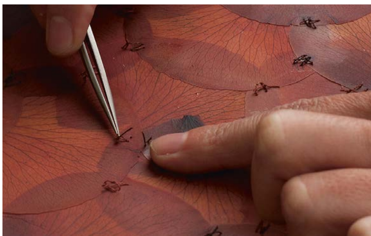
Figura 1. A flor de piel (2012), de Doris Salcedo 1

A flor de piel (2012), de Doris Salcedo, consiste en un enorme sudario creado a partir de cientos de pétalos de rosa suturados entre sí, que conforman un homenaje a una enfermera colombiana torturada y asesinada en las luchas civiles del país [Figura 1].