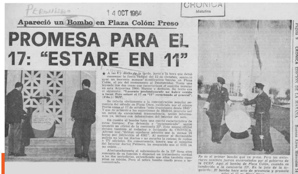
Figura 2. Recorte del artículo publicado el 14 de octubre, en la edición matutina (1964).

El 14 de octubre, día posterior a la aparición del bombo, se publicó en ambas ediciones de Crónica , tanto la matutina como la denominada «quinta edición», la noticia de la confiscación del instrumento o, como lo plantea la redacción de ambas notas, su detención. Si ya el uso de la primera persona del singular en la leyenda inscripta sobre el instrumento sugiere una personificación, el empleo de enunciados como «preso e incomunicado» o «no estará solo» dentro de los textos periodísticos da cuenta de la potencialidad del bombo de vestirse como una representación del movimiento peronista [Figura 3]. En tal sentido, es posible observar en el tratamiento que al bombo se le da, formulado a través de recursos humorísticos y retóricos, los indicios de una indisolubilidad del vínculo entre Perón, el peronismo y el instrumento musical.