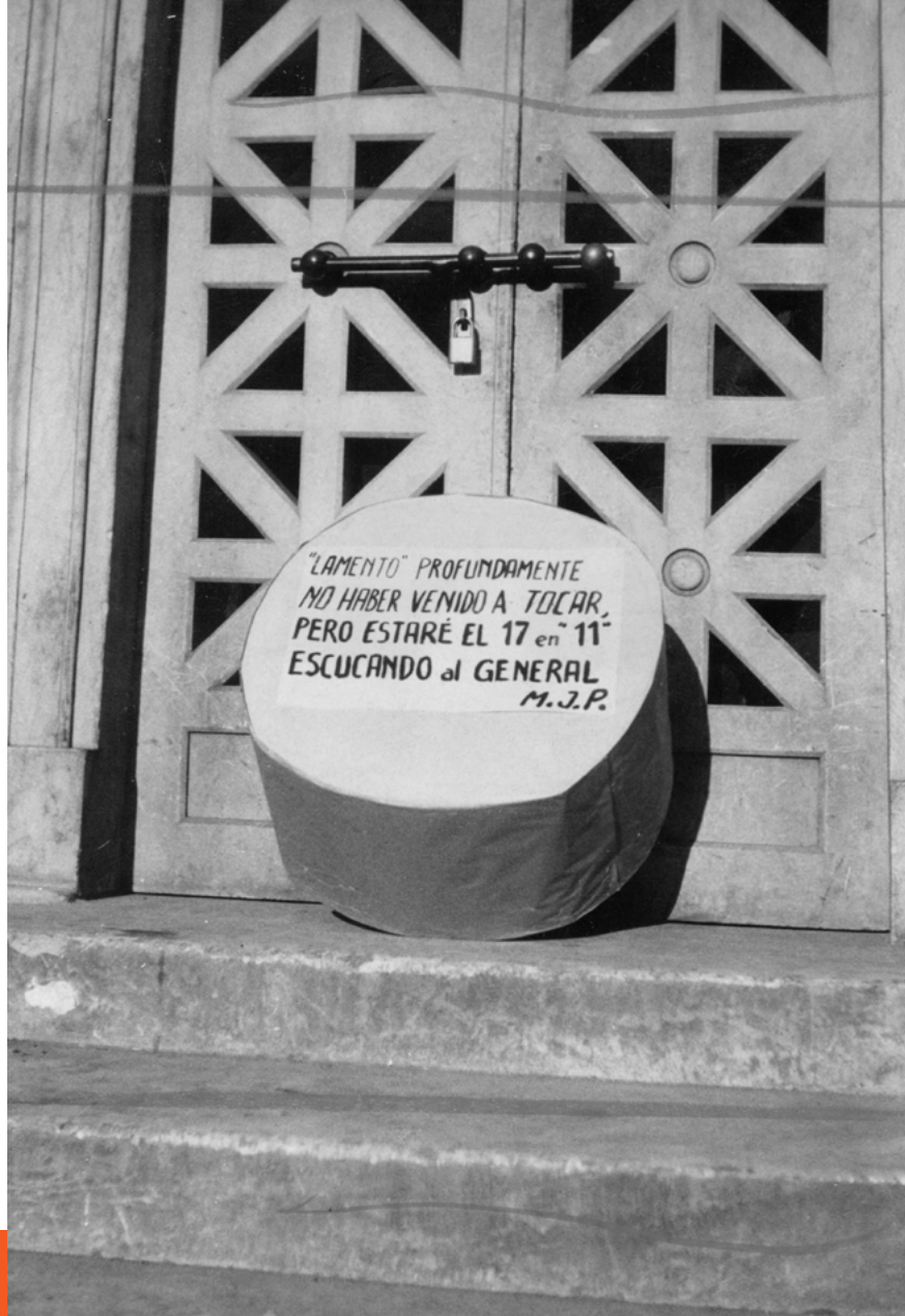
Figura 1. Fotografía del bombo incautado (1964).