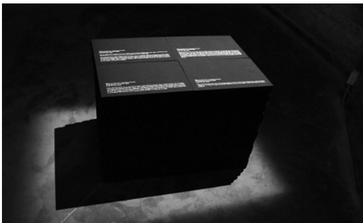
Figura 1. Real Pictures (1995), Alfredo Jaar. Instalación exhibida en el Museum of Contemporary Photography, Chicago

Ejemplo de una representación apropiada de lo intolerable es la instalación Real Pictures , del artista chileno Alfredo Jaar [Figura 1]. La obra problematiza la elección del dispositivo como gesto significativo, pues con las cajas negras brinda una representación del genocidio de Ruanda. 3 Las fotografías que testimonian la masacre permanecen invisualizables ; Jaar ofrece una serie de textos que, inscriptos sobre la superficie de las cajas, funcionan como elementos visuales que no niegan, sino que establecen con estas visualidades obturadas una suerte de transacción.