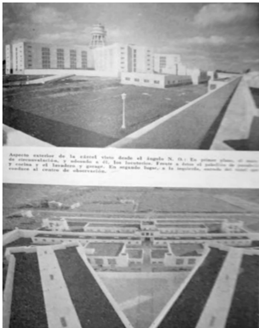
Figura 3. Fotografías de la Unidad 1 de Olmos pertenecientes al Álbum Banco Crédito Provincial , publicadas en la Revista Penal y Penitenciaria (1939).

provincia en los años de la inauguración de la cárcel. A pesar de que desde el archivo se apela al álbum como un obsequio de la constructora al Banco Crédito Provincial, la circulación de estas imágenes por ámbitos oficiales y de propaganda política, como también los puntos de contacto que vislumbramos entre la fotografía de registro estatal realizada por los talleres del MOSP, nos suscita más interrogantes que certezas: ¿cómo explicamos su circulación en estas publicaciones?