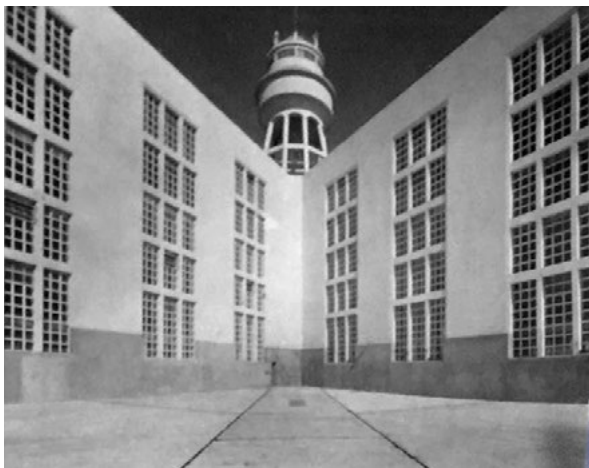
Figura 4. Patio de la cárcel de Olmos (1939).

arquitectónica es radial, consta de pabellones distribuidos en seis plantas y en cada una de ellas se ubican doce pabellones colectivos que convergen a un núcleo central en forma hexagonal, en el cual se ubica un gran patio para iluminación y aireación de diferentes dependencias.