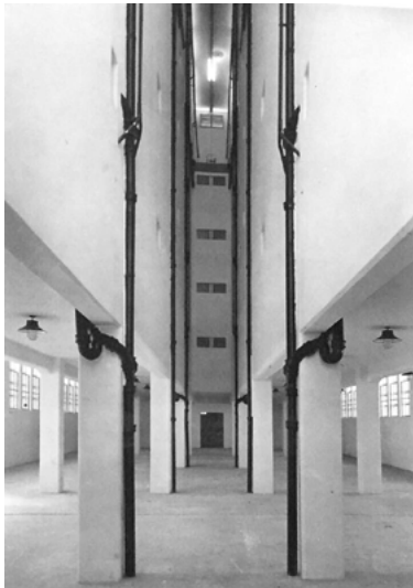
Figura 6. Vista de talleres y pozo central de ventilación de la cárcel de Olmos (1939).

Ahora bien, reflexionemos sobre las fotografías de la cárcel. En primer lugar, si pensamos en cualquier cárcel o presidio, difícilmente se nos venga a la mente una imagen pulcra, de líneas limpias y sin personas. Estas fotografías difieren con la realidad, no tanto por la distancia temporal que las separa del momento en el que fueron tomadas, sino en que no coinciden con el sentido de uso de la institución [Figura 6]. Un espacio para ser ocupado no concuerda con la imagen pulcra y vacía en la que consisten estas fotografías. El corte temporal que supuso el cierre del obturador dejó atrapado, junto con las partículas de luz, un desierto tan alejado de la realidad como problemático.