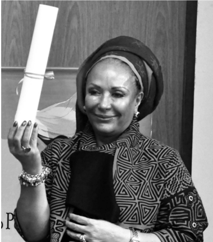
Figura 1. Entrega del título doctor honoris causa a Piedad Esneda Córdoba Ruiz (2013).

Una minoría muy notoria que también es menester destacar es la de los artistas plásticos, solo dos llegan a ser reconocidos y en ambos casos son hombres: Emilio Pettoruti y Shigeo Fukuda. 2 Los reconocimientos en artes están orientados, en su mayoría, a la arquitectura (Niemeyer Soares Filho, Oscar; González de León, Teodoro y Solsona Justo, Jorge), a la composición musical (Rezzano, José; Ginastera, Alberto Evaristo y Schifrin Boris, Claudio «Lalo») y a la literatura (Mallea, Eduardo; Vicent, Manuel; Sábato, Ernesto; Borges, Jorge Luis; Eliade, Mircea; Lynch, Benito; Rojas, Ricardo y Marasso, Arturo). Por lo tanto, reconocemos que puede existir una jerarquización de poder al comprobar las escasas menciones de honoris causa a mujeres y ningún otorgamiento a mujeres artistas.