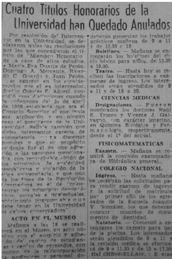
Figura 2. Nota periodística publicada en el diario El Argentino (8 de diciembre de 1955)

Luego de la vuelta de Juan Domingo Perón al país este caso fue revisado y el 20 de julio de 1973 el título le fue restituido y se la declaró doctor honoris causa [Figura 3]. Como consecuencia, la Ordenanza N.º 181 del Estatuto de la Universidad fue modificada para incluir el artículo 12 según el cual los títulos doctor honoris causa son de por vida .