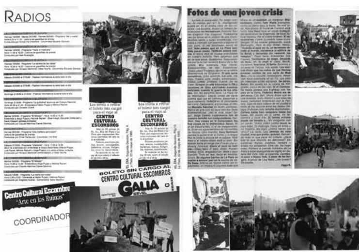
Figura 3. Archivo personal de Héctor Puppo sobre Grupo Escombros, versión digitalizada

Los documentos que presenta el archivo son fotográficos y escritos y, así, quedan relegados los registros audiovisuales y sonoros, como las entrevistas en programas de televisión y de radio. Aunque estas sean mencionadas especificando