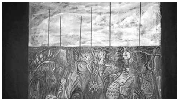
Figura 8. Visión subjetiva del día después (2014), Gabriel Fino