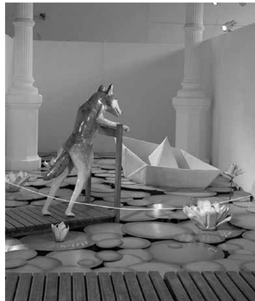
Figura 9. ¡Mirá cuántos barcos aún navegan! (2008), Marcela Cabutti

La muestra Territorios Conmovidos suscitó una ola de profundo interés tanto en la comunidad académica y artística de la ciudad de La Plata como en el público general que visitó las salas del MACLA en el Pasaje Dardo Rocha. El espacio de las visitas guiadas que se realizaron junto con el equipo educativo