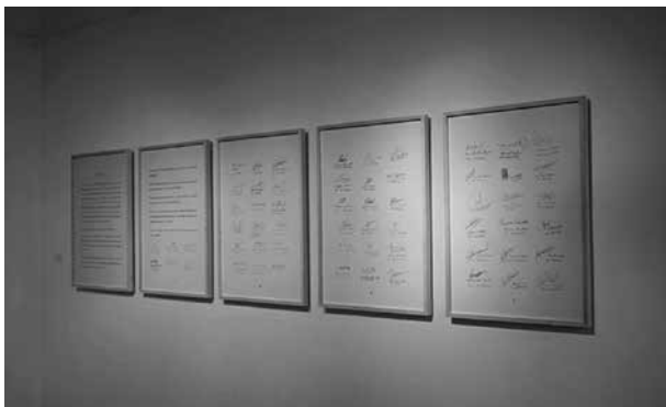
Figura 5. Documento (2014), Paula Massarutti