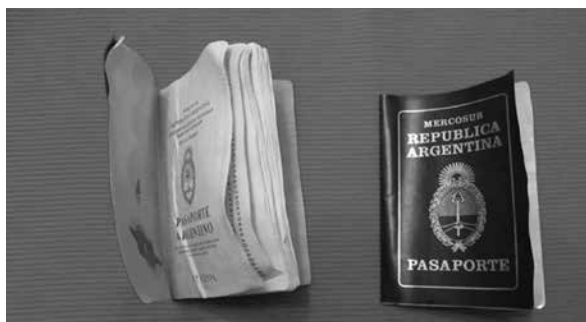
Figura 7. Las cuatro de la tarde (2014), Mariela Cantú