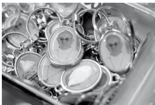
Figura 2. Medallas con la fotografía del papa Francisco