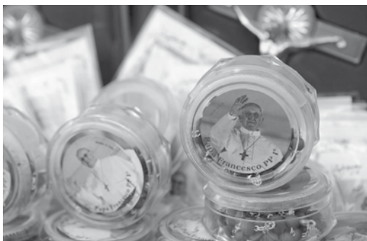
Figura 1. Rosarios con la imagen del papa Francisco