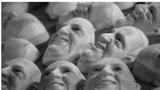
Figura 3. Máscaras del papa Francisco

mostrará la construcción de un ídolo acrílico que representa a una sociedad homogénea, que está constituida por una estetización de la realidad cotidiana. Esta realidad se caracteriza por la liviandad de la representación y por el vaciamiento de significación y de interpretación (Richard, 2007). Las posibilidades de estas representaciones se pondrán en tensión con los discursos que sostienen desde lo visual. Por todo lo dicho, se analizará si la capacidad crítica y política es una especificidad única del arte o si los Estudios Visuales comparten esa característica y pueden aplicarse a este caso.