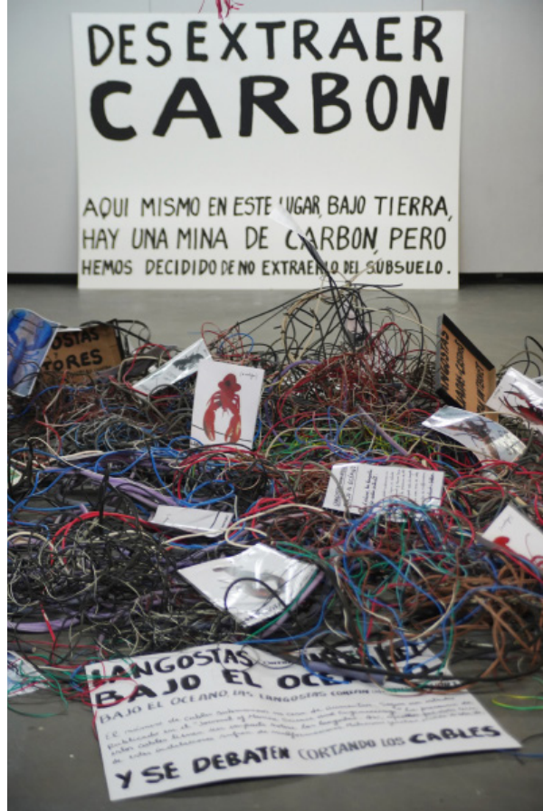
Figura 2. Carlos Ginzburg, Chtonic Futur (2022). Centro de Arte UNLP.

Aquella decisión de no extraer recursos naturales desde las entrañas donde se apoya el Centro de Arte contrasta con la instalación en el exterior donde se localiza la estola dramática de un derrame petrolero graficada en un largo sendero de tinta negra esparcida [Figura 3]. Es interesante en este sistema de contrastes observar cómo operan, al adherirse a las formas orgánicas, dibujos y desechos que a partir de un sinnúmero de alianzas eventuales empiezan a comunicar. La naturaleza no está quieta; en las redes tejidas por raíces y hongos, entre langostas y castores se consolida la dinámica de una contrainsurgencia cuyos efectos no podemos pronosticar. Son los indicios del desastre y sus derivas.