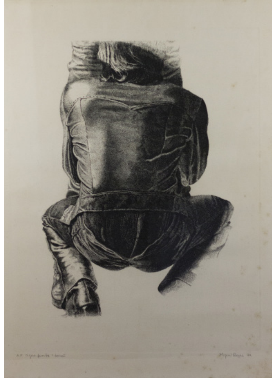
Figura 2. Boca , (1974). Miguel Ángel Rojas. Aguafuerte. Archivo Queer, Archivo Arkhé