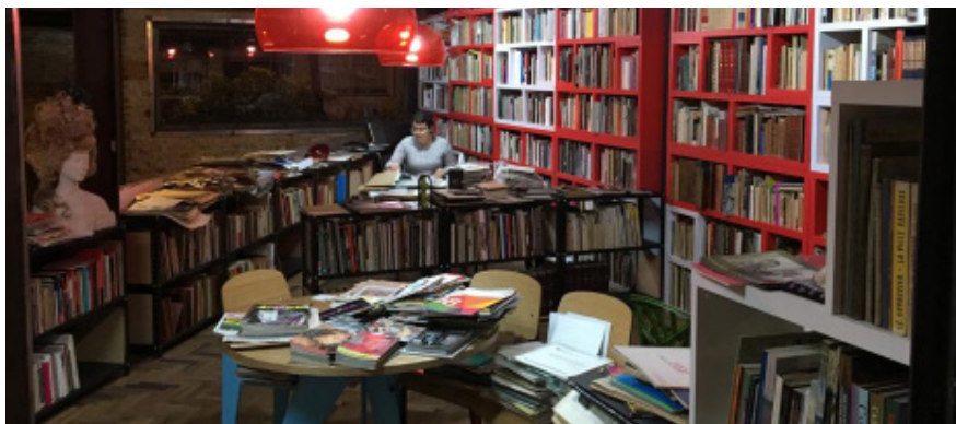
Figura 7. El Archivo Arkhé en su primera sede en Bogotá, 2015-2022

Los materiales documentales que conserva Arkhé son, prácticamente en su totalidad, fruto de la compra directa con recursos económicos personales y familiares. Nunca he recibido, por parte de institución alguna, la donación de archivos o materiales documentales o bibliográficos. Mientras el Archivo Arkhé operó en Colombia (2015-2022), tampoco recibimos recursos públicos para la operación: todo se mantuvo con recursos personales y privados. Esto permitió mantener la independencia de nuestro trabajo frente a los vaivenes de lo público y nos permitió disponer de los materiales con total libertad en término de préstamos, movilidad nacional e internacional, etcétera. Al mismo tiempo, el tener recursos limitados sí que impidió que hubiéramos tenido toda la actividad que hubiéramos deseado tener (Figura 7).