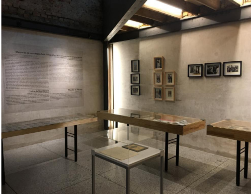
Figura 3. Vista de sala de la exposición Memorias de una utopía: arte, fotografía y activismo alrededor de Mayo del 68 (foto de mayo de 2018).

En ese momento me preocupaban varias cosas: no caer en la endogamia, en el chovinismo de las instituciones colombianas —con excepción del Banco de la República—, que suelen ver la cultura local como autosuficiente, siempre en relación subalterna con Estados Unidos y Europa pero aislada de los demás países latinoamericanos. Para mí, lo mejor era latinoamericanizar el archivo, lo que facilitaría dejar de percibirnos como una isla y trazar las redes intelectuales y de solidaridad histórica entre Colombia y los demás países de la región, que fueron más fuertes que lo que la historiografía tradicional suele asumir. Algunos me crucificarán por lo que diré, pero creo que los colombianos no nos hemos tomado el tiempo de pensar colectivamente nuestro lugar en el mundo o el sitio que queremos en el diálogo planetario: siempre andamos mirándonos al ombligo, pensando en las urgencias cotidianas y en las catástrofes que requieren solución inmediata —y es innegable que hay que trabajar en la solución de estos problemas—, pero yo creo que a Colombia, aunque