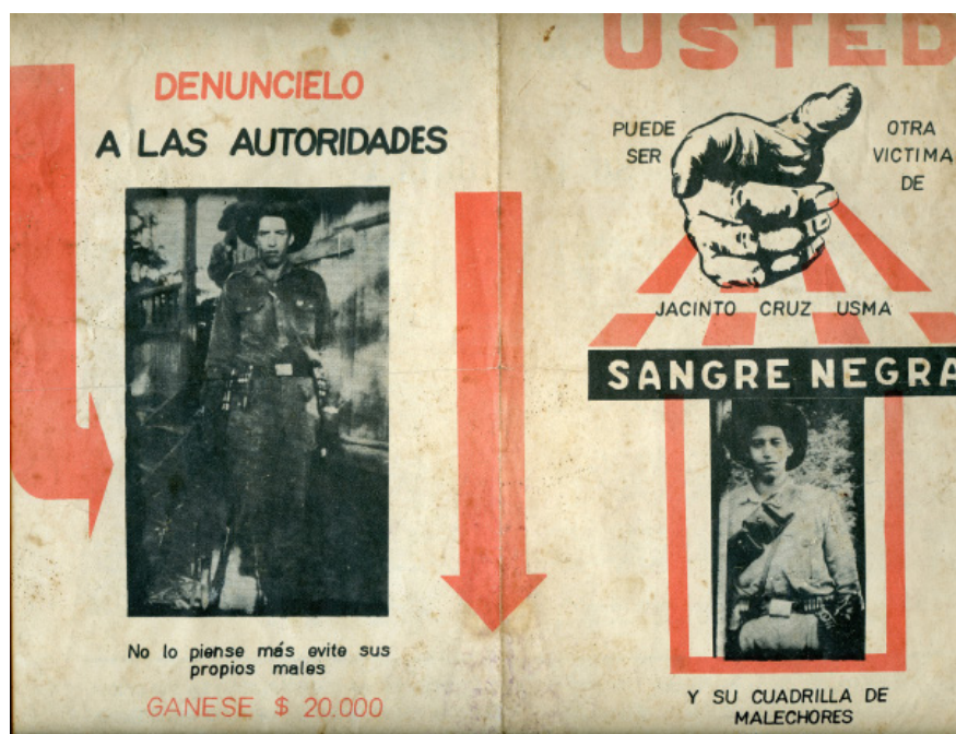
Figura 5. Panfleto de captura del bandolero Sangre Negra (1962). Colombia, Ca. Impresión. Colección Viajeros, Territorio y Paisaje, Archivo Arkhé

b) Viajeros, territorio y paisaje: me interesa analizar la experiencia del viaje en la praxis artística y ver cómo se moldean, a través de las imágenes, las relaciones neocoloniales entre el viejo y el nuevo mundo. Esta colección es una amalgama de imágenes —fotográficas, grabadas, pictóricas, en dibujo— de la naturaleza y de aquellos sujetos otros —indígenas, negros, mestizos— cuya imagen suele ser invisible en los libros de historia y cuya presencia en los archivos oficiales suele ser incidental, colateral o desde la mirada del enemigo o del censor (Figura 5).