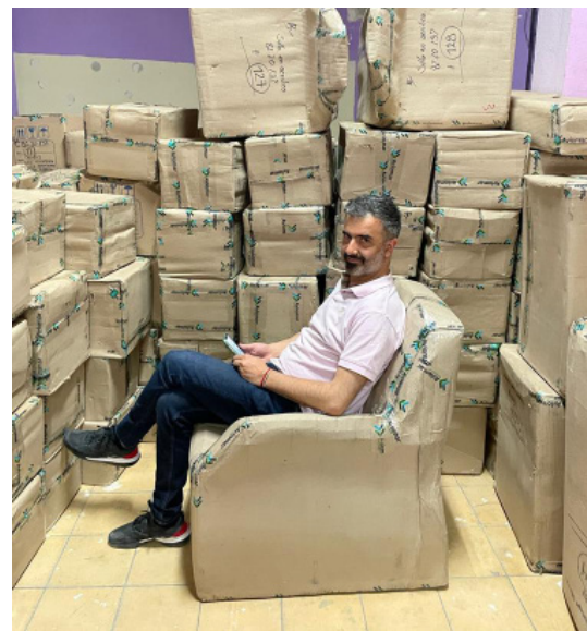
Figura 8. Traslado del Archivo Arkhé a Madrid, junio de 2022

Hay dos frentes de compra: por un lado, fondos particulares y, por otro, materiales sueltos. Los materiales sueltos se adquieren a través de librerías y casas de subastas —tenemos contactos en varios países de América Latina, Estados Unidos y Europa— que nos llaman. Los fondos se adquieren normalmente a sus productores o herederos directos, y contamos con el apoyo de dos personas en este frente. Llevamos un par de años en que hemos disminuido la cantidad de adquisiciones para concentrarnos en la apertura del espacio en Madrid, en procesar los materiales que ya tenemos y en lanzar el archivo virtual, asignaturas pendientes por haber privilegiado las adquisiciones; pero en su momento era lo urgente. Hoy en día todo el mundo parece tener mucho afán, pero yo no trabajo al zumbido de las modas ni presionado por las exigencias de inmediatez en los procesos: Arkhé es un proyecto lento, que tomará una o dos generaciones para consolidarse, no me programo a tres meses (Figura 8).