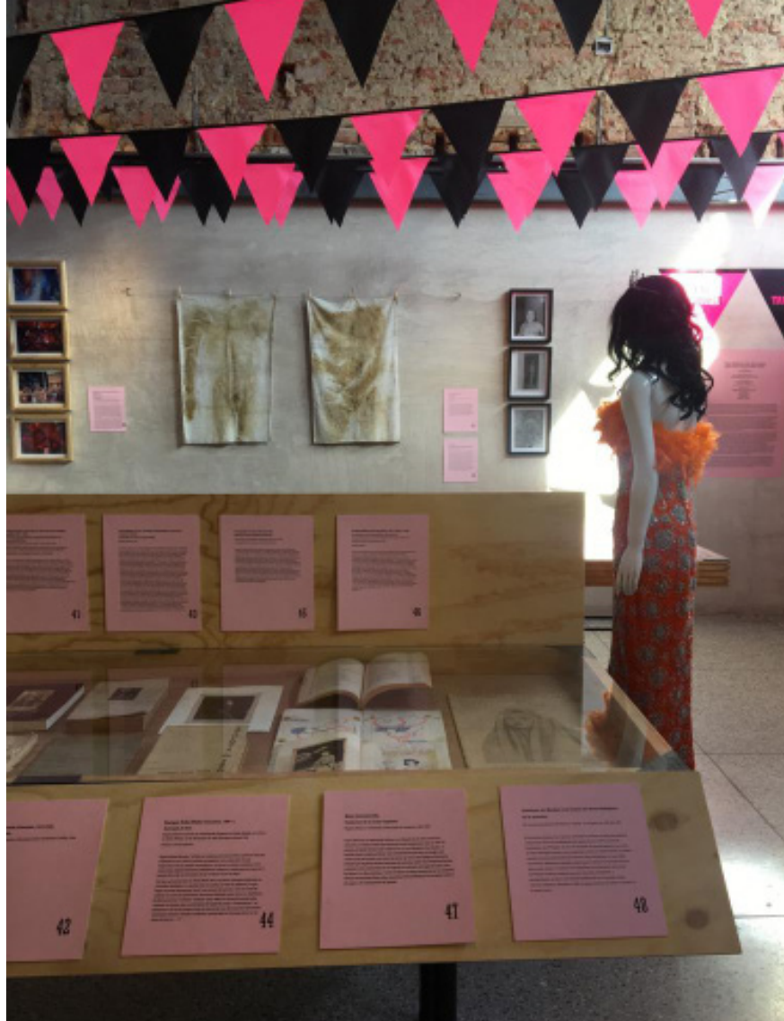
Figura 12. Vista de sala de la exposición Una historia (no tan) rosa: Historia natural de la homosexualidad, 1793-2016 (foto de agosto de 2018), en la primera sede del Archivo Arkhé, en Bogotá

En 2022, hice un replanteo curatorial de esta exposición que será el evento inaugural del Archivo Arkhé en Madrid. Ahora se llamará Una historia (no tan) rosa: breve historia cultural queer , y buscamos cuestionar, desde el Sur Global, cómo el activismo y la historiografía anglosajona han venido construyendo un relato hegemónico e internacionalista de la historia universal LGBTI+, en la que el Sur Global es presentado como reactivo frente a los ejes intelectuales y espirituales del activismo anglosajón. Me interesa cuestionar la stonewallización del relato histórico y rescatar algunas voces literarias y artísticas que se han olvidado en la historia hispanoamericana y que son una raíz genealógica potente para las numerosas inquietudes locales del presente. En todo esto me parece interesantísima la literatura latinoamericana anterior a 1939, en donde hay varios autores que trabajaban en red e incluso se carteaban, dedicados a vindicar el amor que no se atreve a decir su nombre .