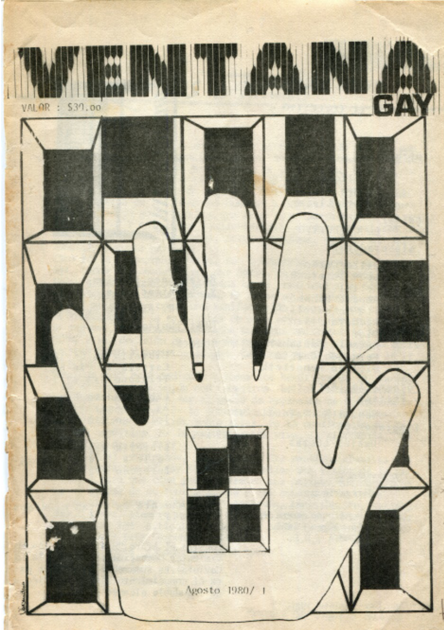
Figura 1. Ventana Gay , no. 1, (1980). Colección de publicaciones periódicas. Archivo Queer, Archivo Arkhé