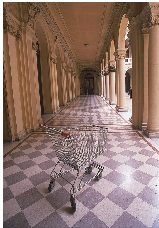
Figura 4. Fotografía 0991: Rosana Schoijett(2001). Fototeca ARGRA

Por otro lado, las fotografías de Rosana Schoijett parecieran ajenas a los hechos del afuera, aunque pueden igualmente relacionarse con esa crisis institucional que se manifestaba en las calles. En una de las imágenes se observa un chango de supermercado vacío en las galerías laterales, también vacías, del Patio de las Palmeras, en el interior de la Casa Rosada, lo que sugiere la ausencia y el desorden presente en ese momento de caos [Figura 4]. Rosana Schoijett nos describe el interior de la escena: «La Casa Rosada se encontraba vacía y desordenada, se podían observar changos de supermercado llenos de carpetas, papeles, entre otros materiales, sugiriendo la idea de una rápida evacuación» (R. Schoijett, comunicación personal, 2 de diciembre de 2020).