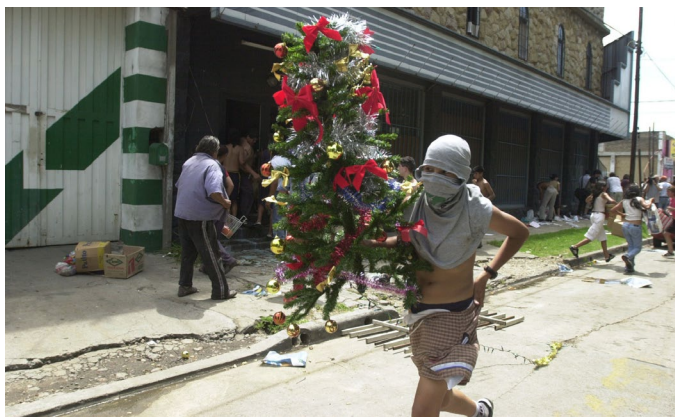
Figura 3. Foto 0005: Ricardo Abad (2001). Fototeca ARGRA

La descripción de las imágenes que realiza el repositorio añade lo siguiente: «Saqueos en un supermercado de la localidad de Ramos Mejía, Buenos Aires» (Fototeca ARGRA, 2019). Lo que alude al señalamiento de los hechos, y los alcances que tuvieron lugar ante la crisis generada por el rechazo y la oposición a las medidas impuestas por el gobierno.