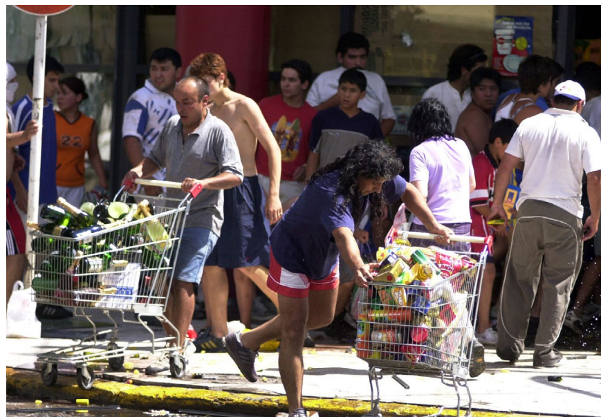
Figura 1. Foto 0013: Ricardo Abad (2001). Fototeca ARGRA

La fotografía 0013, seleccionada para este análisis [Figura 1], presenta en primer plano a un hombre con un chango de compras cargado de alimentos, mientras que a la izquierda se puede observar a otro hombre llevando un carro lleno de bebidas alcohólicas. Puede destacarse que la mayoría de las personas en esta imagen son hombres.