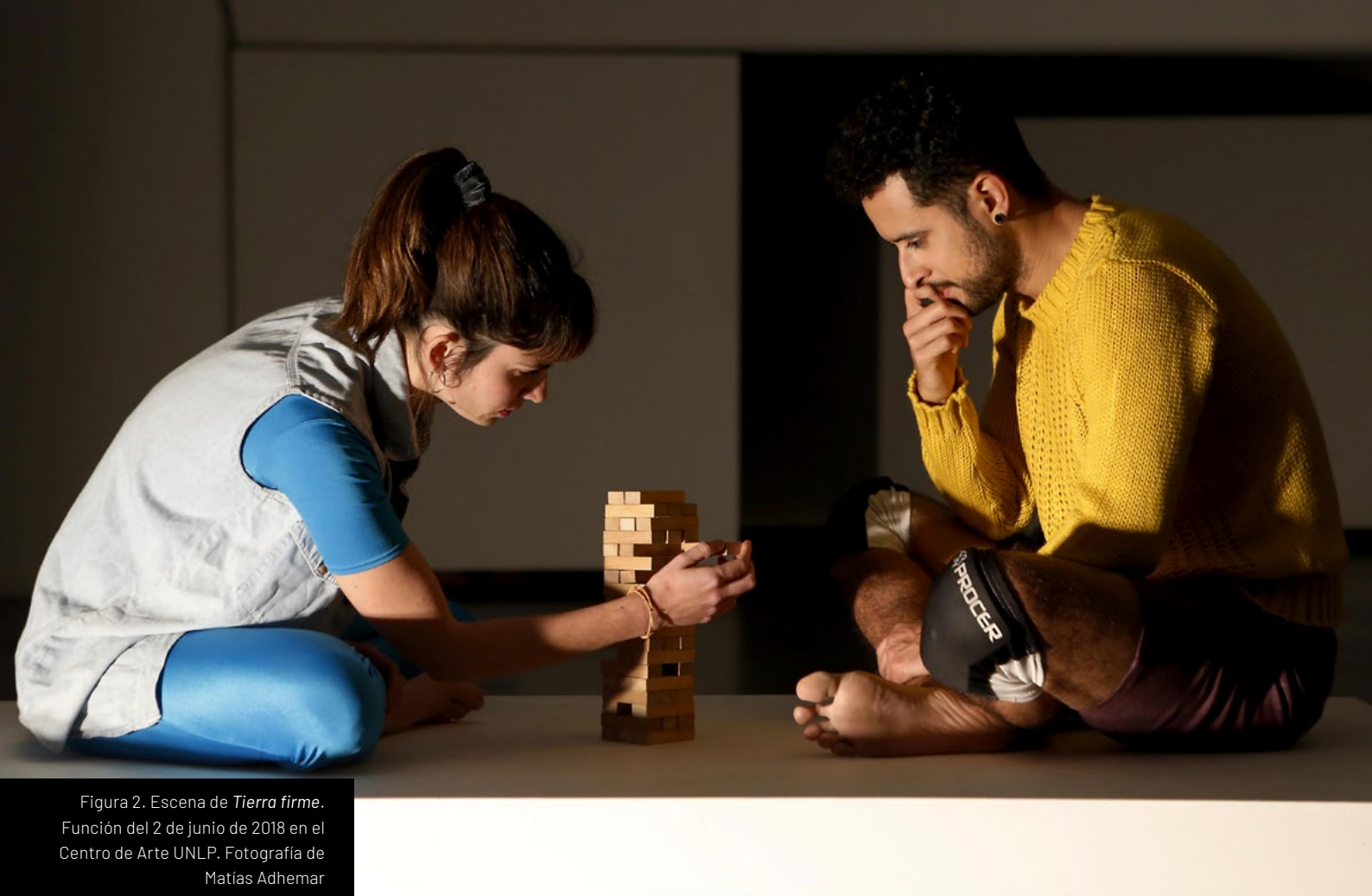
Figura 2. Escena de Tierra firme . Función del 2 de junio de 2018 en el Centro de Arte UNLP.

Durante el proceso de construcción de la obra aparecieron imágenes, ideas de movimiento y acciones físicas relacionadas con el sostener. En algunos casos, devenían de la gestualidad más directa del cuidar al otro: acunar a un bebé, abrazar, escuchar, contener desde un toque afectuoso, alzar a alguien como en un juego infantil. En otras, la búsqueda nos llevó a imágenes más abstractas o con una relación menos directa con la idea de cuidado: la imagen de red, la construcción de un jenga con cuerpos, la caída y la recuperación.