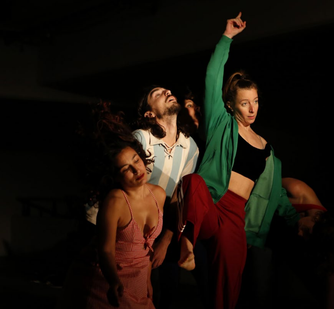
Figura 1. Escena de Tierra firme . Función del 2 de junio de 2018 en el Centro de Arte UNLP.

Aula 20 fue creado en 2010 desde la cátedra Trabajo Corporal I de la FBA como un espacio de investigación e intercambio desde la danza con las otras disciplinas presentes en la Facultad. A lo largo de estos años, nuestro modo de trabajo estuvo basado en la creación de obras multidisciplinares dirigidas por las coordinadoras del grupo. En esta última, Tierra firme , se experimentó en una producción horizontal que implicó que todxs lxs integrantes pudieran proponer líneas de investigación del movimiento, tuvieran el mismo nivel de decisión sobre el desarrollo de la obra y, además, que todxs bailasen, incluidas las directoras. Se desarrollaron diversas estrategias para estar adentro y afuera, para participar en los diferentes roles, con un delicado ejercicio de escucha, respeto y paciencia.