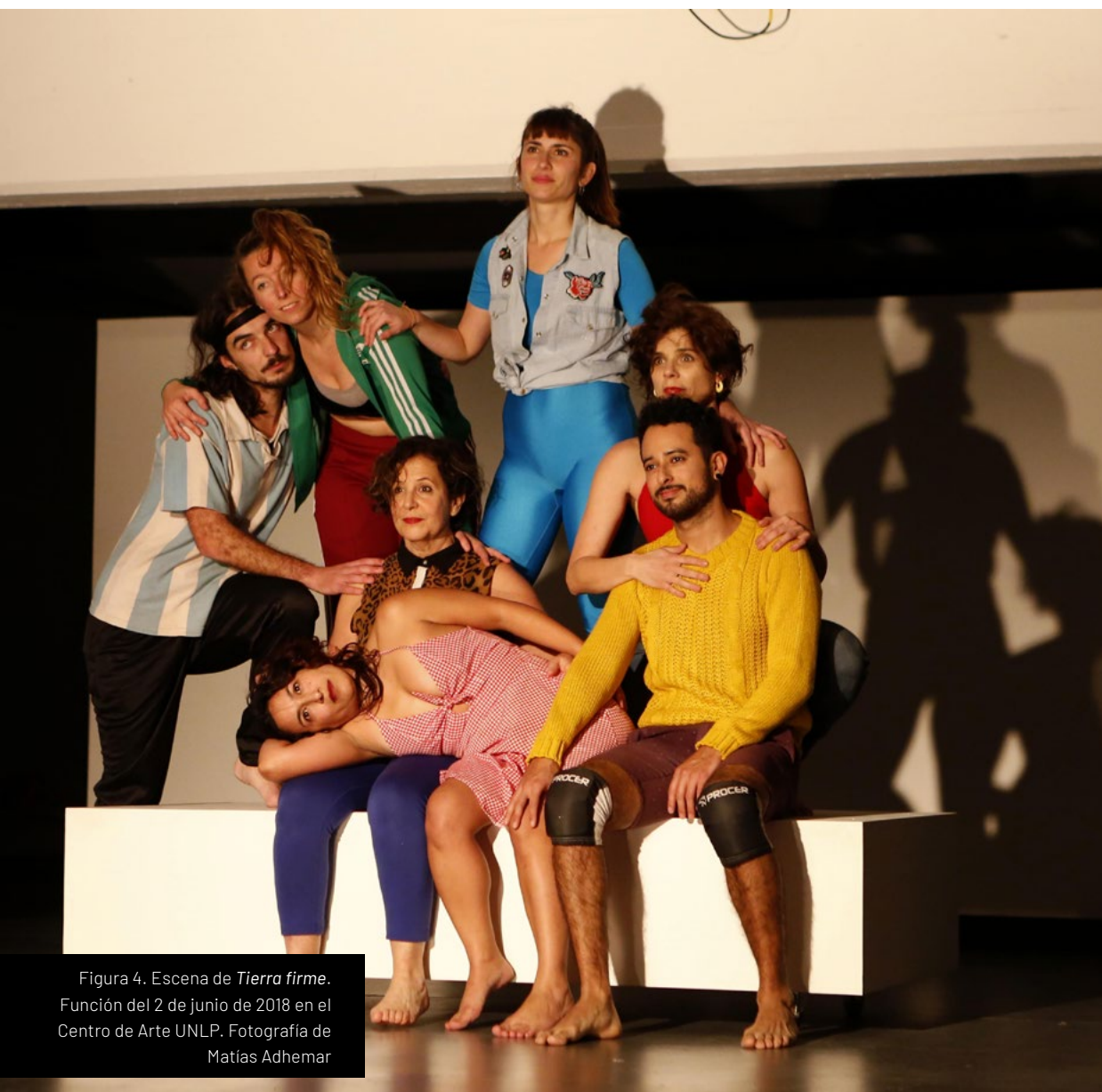
Figura 4. Escena de Tierra firme . Función del 2 de junio de 2018 en el Centro de Arte UNLP.

De todos modos, y como casi siempre sucede, con el tiempo las cosas se recomponen —al decir de Clarice Lispector (1947), nuestros propios defectos pueden construir nuestro edificio entero— 2 y podemos reagruparnos, abrazarnos y finalmente sacarnos una foto en familia hasta que un nuevo quite de sostén haga tambalear la estructura, para volver a armarla y armarnos y así.