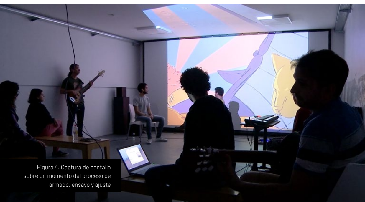
Figura 4. Captura de pantalla sobre un momento del proceso de armado, ensayo y ajuste