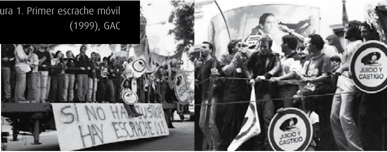
Figura 1. Primer escrache móvil (1999), GAC

El segundo caso elegido, la cartografía crítica Megaminería en los Andes Secos , es uno de los resultados de una serie de jornadas llevadas a cabo por Iconoclastas en colaboración con distintos agentes sociales. Desde 2008 hasta 2010, en distintas ciudades argentinas se desarrollaron mapeos y se crearon cartografías que hacen eje en las problemáticas principales de cada sector. Los recursos utilizados para la construcción de la imagen analizada son símbolos que hacen referencia a la señalética vial, al igual que en el caso anterior. Esta elección posiciona a los participantes en una dimensión de denuncia activa sobre una urgencia que incluye, también, el trabajo que se ha hecho y se está haciendo desde las organizaciones locales. Las prácticas de Iconoclastas tienen que ver con una actualización de la pedagogía social emancipatoria , que planteó Paulo Freire, en un espacio de coaprendizaje y coproducción signados por el intercambio de saberes especializados o no y la modificación de subjetividades (Expósito, 2013).