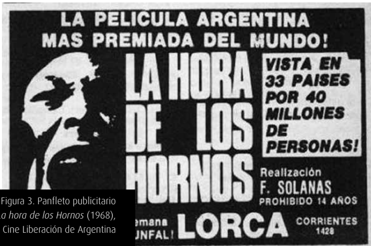
Figura 3. Panfleto publicitario de La hora de los Hornos (1968), del Grupo Cine Liberación de Argentina

Al puntualizar en la cuestión de la estética cinematográfica de estos filmes, entendemos y coincidimos en que «la cuestión sigue siendo problemática porque la belleza no es solo una cuestión estética, sino que su historial arrastra, desde siempre, dimensiones ontológicas (remite al problema del ser) y repercusiones axiológicas (actúa como un valor)» (Escobar, 2012: 52). Así lo han entendido estos cineastas con sus diferentes y sus propias formas de interpretar el espacio fílmico, el montaje y la narración. Nos referimos a las distintas propuestas construidas en las obras cinematográficas mismas, por ejemplo, a las del Grupo Cine Liberación de Argentina, dirigido por Pino Solanas y por Octavio Getino, que exhibieron, en 1968, La hora de los Hornos [Figura 3]; o a los diferenciales resultados que encontramos en las propuestas narrativas y estéticas de Glauber Rocha desde Brasil.