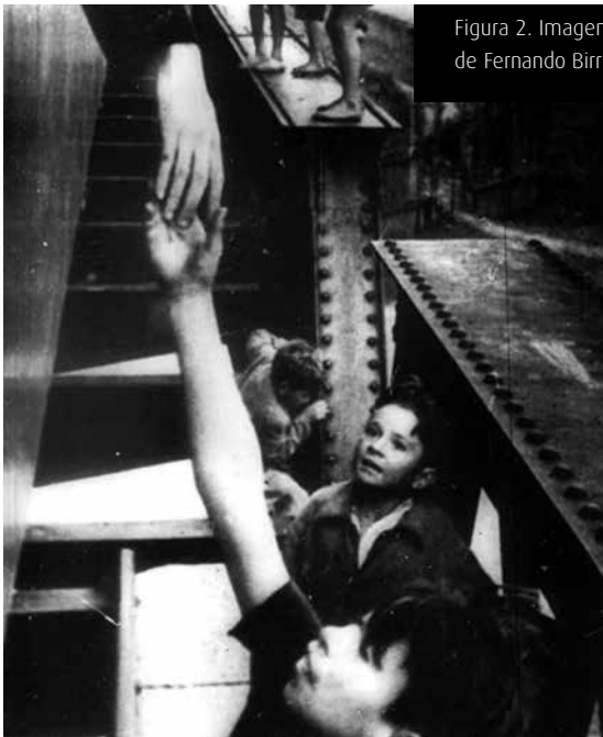
Figura 2. Imagen de Tire dié (1960), de Fernando Birri

El caso de Birri es el mejor antecedente para relacionar cine y trabajo etnográfico. Tire Die (1960) fue la primera experiencia de cine documental/encuesta, en ella los protagonistas son niños que corren junto al tren que une Rosario y Buenos Aires para que los pasajeros les tiren monedas [Figura 2]. En la obra, Birri no busca dar cuenta de la verdad , sino darle la palabra y la imagen a ese otro invisibilizado por el cine hegemónico, «mediante este trabajo que podríamos llamar de rastreo del potencial humano, será el pueblo mismo quien tome participación en el hecho cinematográfico» (Birri, 1964: 28); y pone la responsabilidad en el espectador, lo que lo incita a una práctica emotiva y racional.