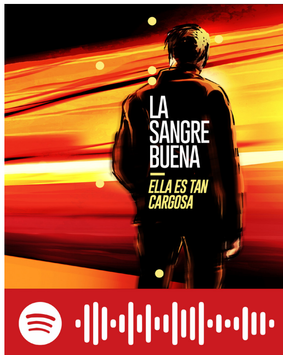
Figura 5. Acceso directo a «La sangre buena». Escaneá el código desde Spotify para acceder a la canción completa

La luz del tren Tiembla y baila a lo lejos Ya estoy de pie, por más que falte un tiempo Será que la sangre empieza a correr Tranquila y limpia otra vez Bien.