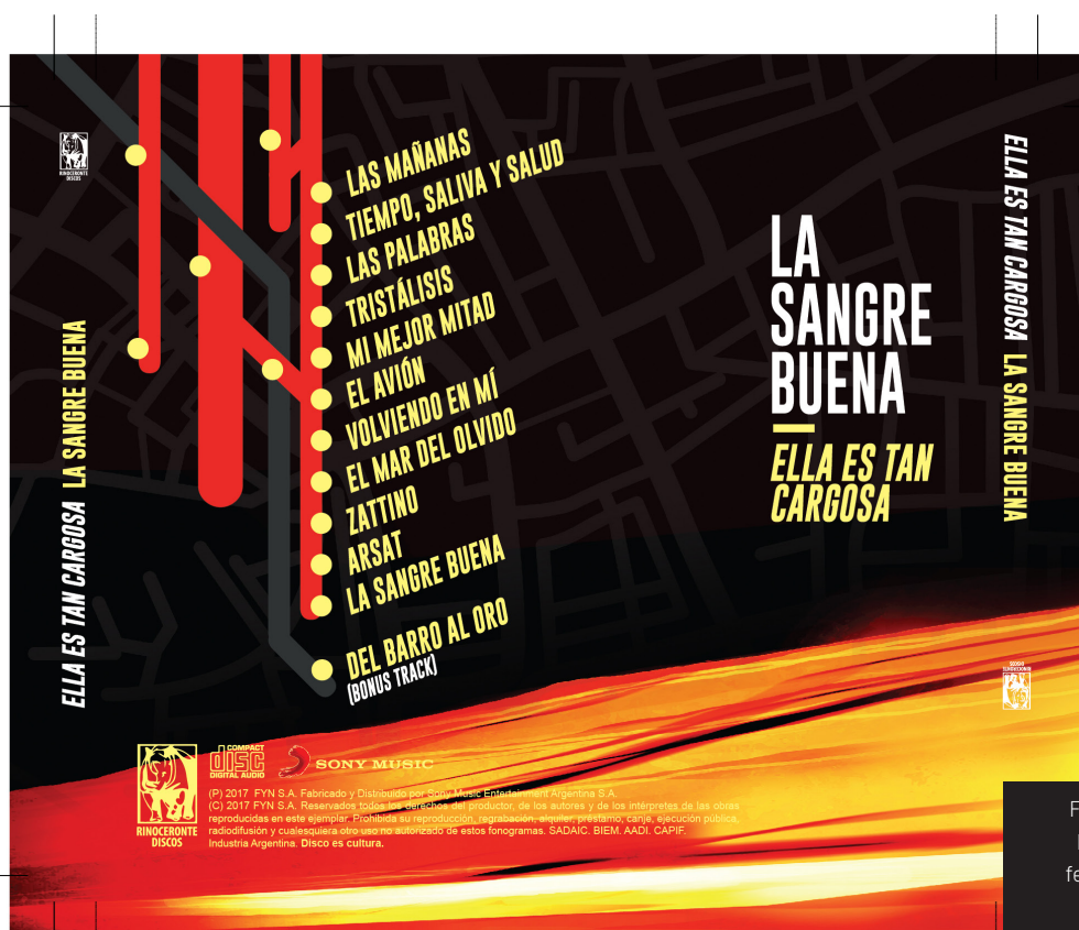
Figura 9. Contratapa del álbum, la sangre a modo de un trazado ferroviario y las canciones como estaciones

El proceso de la contratapa fue más simple, aunque también hace referencia al nombre del álbum con otro juego conceptual, ya que muestra los temas a modo de estaciones en un mapa ferroviario que representa algo así como las venas humanas en donde la sangre buena vuelve a correr otra vez [Figura 9].