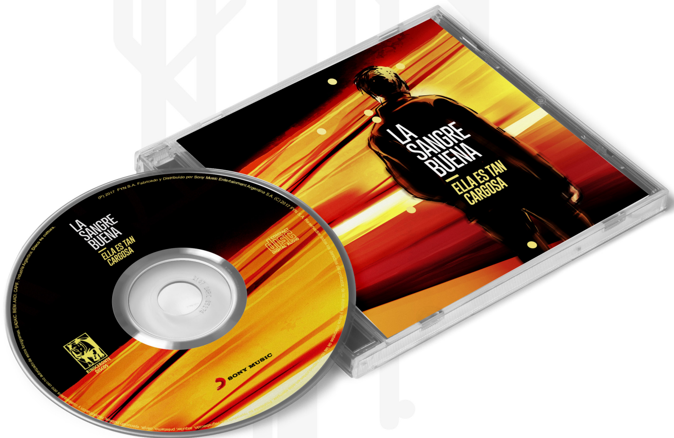
Figura 8. Mockup del CD y arte de tapa de La sangre buena

Asimismo, los colores saturados buscaban enfatizar la pregnancia en una posible batea de discos o el abrirse paso en el contexto de las miles de opciones de tapas digitales en plataformas como Spotify o Youtube [Figura 8].