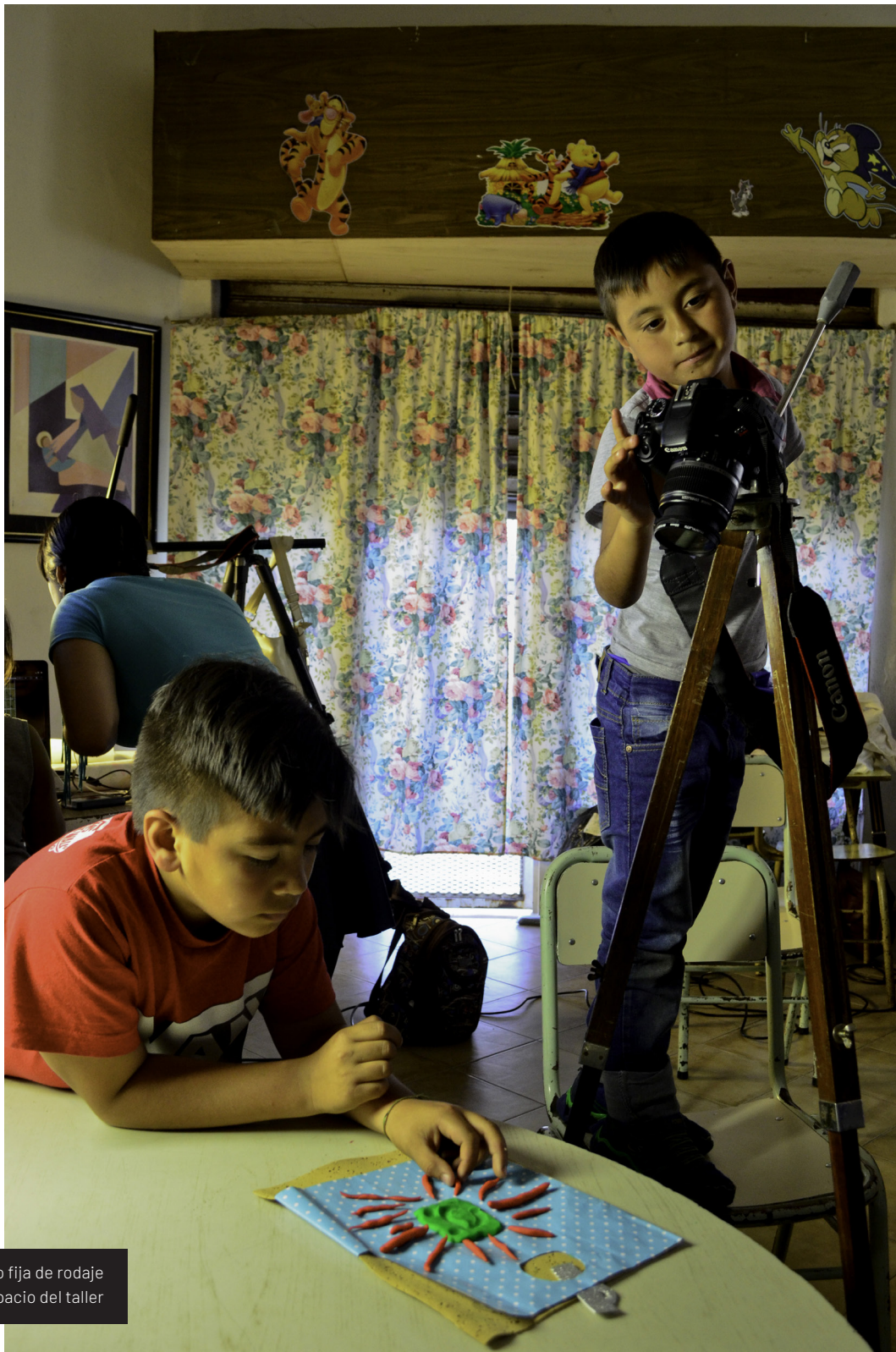
Figura 2. Foto fija de rodaje en el espacio del taller