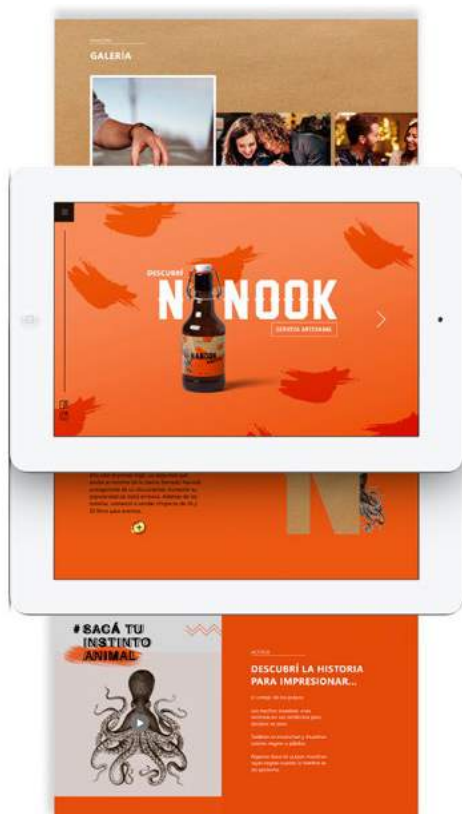
Figura 4. Página web

Las etiquetas de la botella se desarrollaron con realidad aumentada para que se puede visualizar un animal de forma parcial que a través de un dispositivo tecnológico, en este caso, un celular: el usuario visualiza parte del mundo real (la botella) con información gráfica virtual (el animal moviéndose). Los cortejos de forma completa se pueden visualizar en la página web de Nanook.