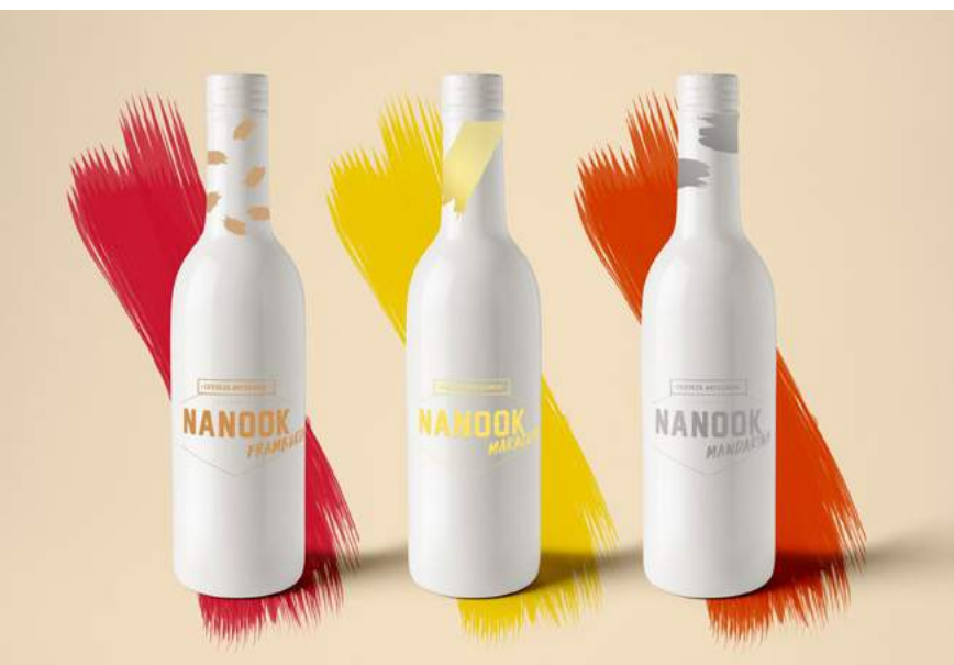
Figura 2. Etiquetas línea premium. Serie limitada de botellas premium y coleccionables

de competidores del rubro y la ausencia de una propuesta diferencial que permita atraer a nuevos clientes y abrirse a nuevos mercados.