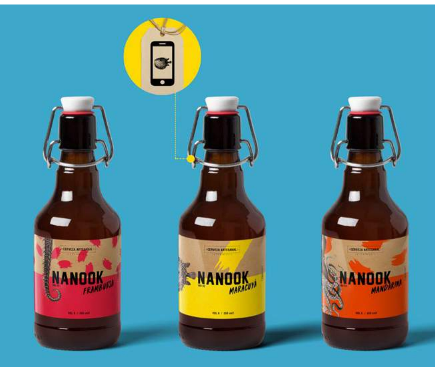
Figura 1. Etiquetas de realidad aumentada