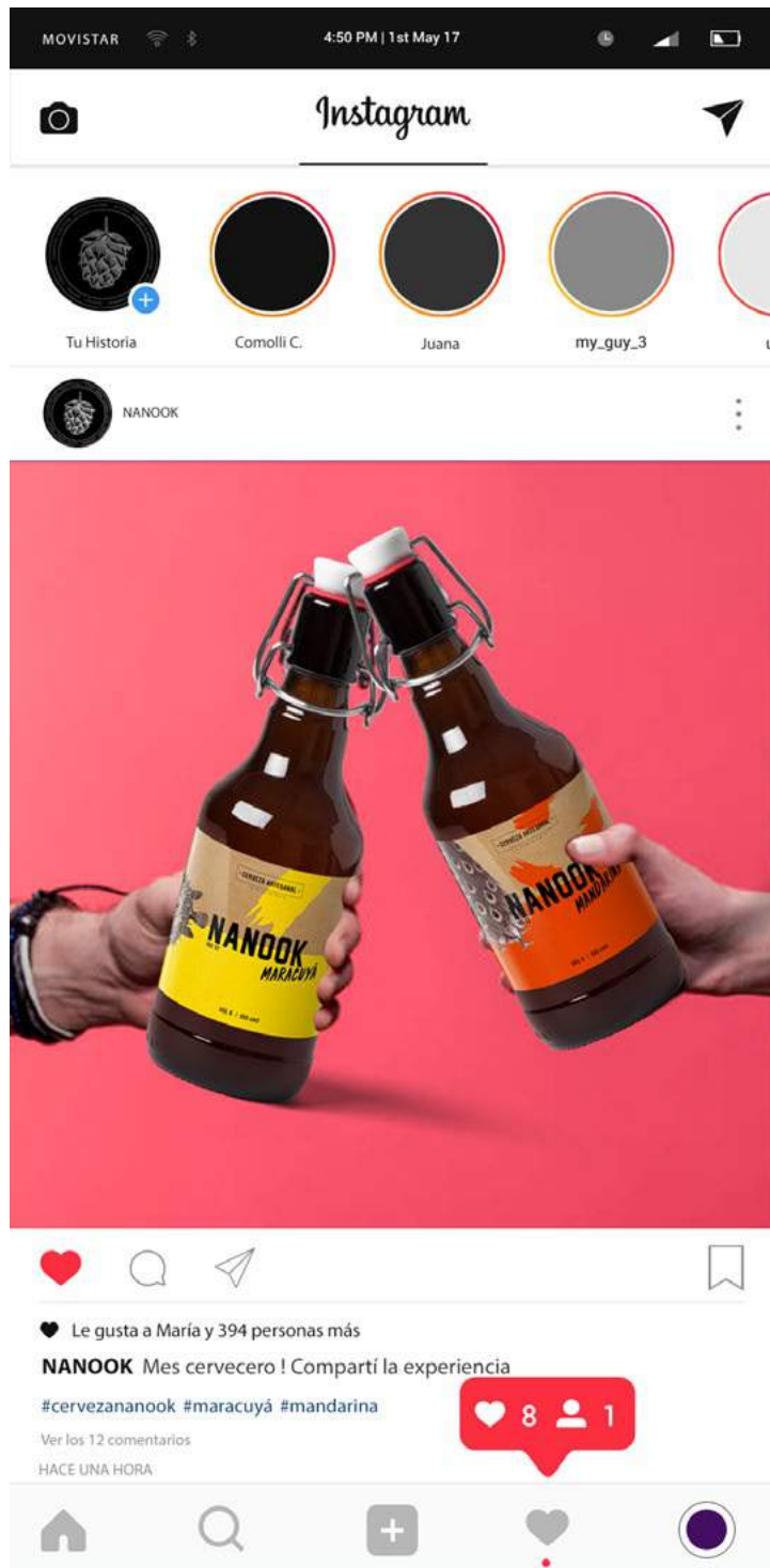
Figura 5. Instagram