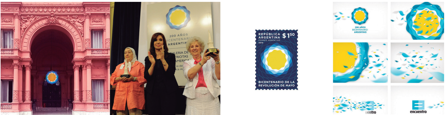
Figura 2. De izquierda a derecha: Casa Rosada (2010). Premio Bicentenario de la Revolución de Mayo a los Derechos Humanos a Madres y Abuelas. Sello postal Bicentenario (2010). Fotogramas de Canal Encuentro (2010)

Encomendada al estudio de diseño Imagen HB por la Presidencia de la Nación, la marca del Bicentenario fue utilizada en la propaganda oficial y aplicada en distintas piezas gráficas, audiovisuales y hasta en edificios públicos, como la Casa Rosada, durante el período 2010-2015 [Figura 2].