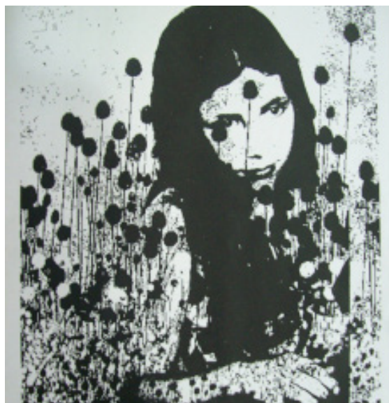
Producción para una página de artista de Victoria

En su proceso de trabajo para hacer la página de artista Victoria le sacó una foto digital a una foto analógica; luego, la trabajó con Word. Convirtió la imagen a escala de grises y produjo una polarización blanco/negro. Como no consiguió, según sus palabras, “una calidad óptima”, hizo de nuevo el mismo proceso, pero en lugar de registrar con una cámara digital la fotografía analógica, la escaneó. Después, incorporó texturas de tramas de telas y de estampados. Finalmente, con la impresora a chorro de tinta, realizó sobrepresiones con las distintas imágenes que generó por medio de Word. En la imagen definitiva, como operación retórica, distinguimos el paralelismo entre la imagen fotográfica que muestra a la alumna cuando era una niña y los motivos vegetales. Esta comparación puede interpretarse como la asociación de la infancia con un momento de plenitud y de crecimiento. También puede pensarse como correlato entre la vida humana y la naturaleza y sus ciclos.