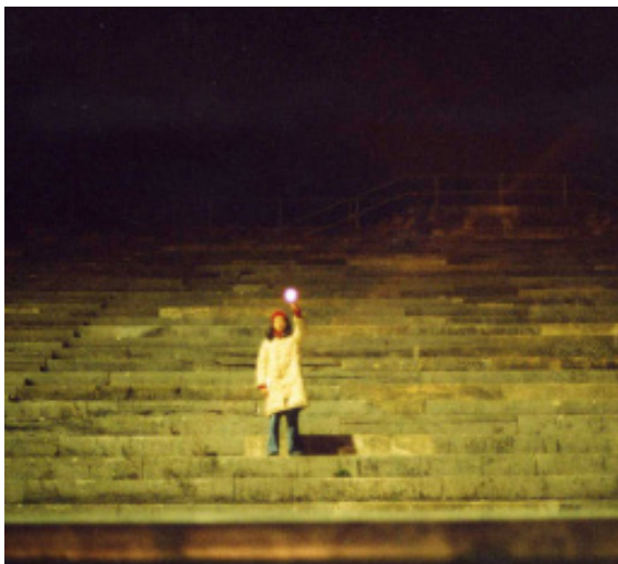
Einwanderung/Inmigración Yo (2004), Vanina Rodríguez