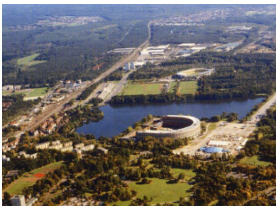
El predio Dutzendteich o Reichsparteitagsgelände con el Koloseo o Kongresshalle, Núremberg (1994). Revista Rund um den Dutzendteich . Nuremberg: Hofmann Druck

A partir del año 1933 el partido Nacional-socialista tomó este sitio para convertirlo en su área para celebraciones. Bajo la tutela de Albert Speer (el arquitecto del partido nazi) se proyectaron y construyeron los imponentes edificios que hasta el día de hoy se conservan. El proyecto final era colosal y lo que se llegó a concretar lo demuestra. El Kongresshalle o Koloseum abruma con su imponente presencia. Toda la arquitectura del nacionalsocialismo estuvo marcada por una ambiciosa nostalgia por los antiguos imperios (sobre todo el romano). El Kongresshalle es una prueba de esta ambición, una cita a aquel imperio.