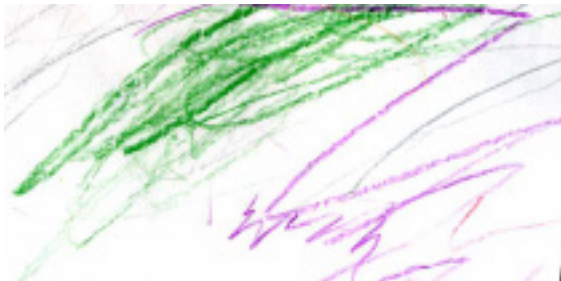
Garabato descontrolado. Trazos de un niño de dos años de edad, Alemania (2011)

Desde su estado latente, el garabato significa. Lleva consigo un núcleo secreto en el que se encuentra implícito su gran potencial. El garabato, desde su gestualidad, incorpora al mundo y se incorpora en el mundo. Luego, con el tiempo y en necesaria evolución, el garabato mutará su descontrol hacia un inicio de control, un intento de intención, una primera comprensión del efecto del gesto y de su movimiento; un primer descubrimiento de ese universo simbólico que comienza a abrirse y a despezarse.