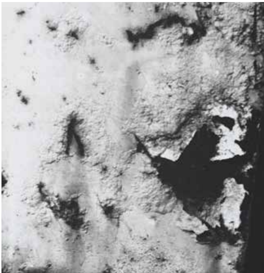
Figura 4. Sin título (1962), Jorge Roiger

Un elemento fundamental que se rescata en algunas obras de los artistas del grupo informalista en general, y en el caso de las fotos de Roiger en particular, es la difusión de la idea de economía de medios. Esta permite analizar en detalle los aspectos principales de la visión plástica, los cuales, en la obra de Roiger, están vinculados a la predominancia de fotografías en blanco y negro con una ausencia total de color. Esta apropiación de la fotografía acromática dialoga no solo con las tradiciones de usos documentales del dispositivo, sino, también, con una concepción de la propia naturaleza de la imagen fotográfica que, desde sus antecedentes con la cámara oscura, se planteaba de acuerdo con los problemas de la luz y con su incidencia en el material fotosensible. Una fotografía como Sin título [Figura 4] es un buen ejemplo para pensar en términos de valores. La relación entre zonas claras y zonas oscuras en la imagen se plantea de acuerdo con la incidencia de la luz que, debido al desgaste de la superficie real fotografiada, solo refleja sobre el plano anterior en contraposición a la zona desgastada que permanece en oscuridad. Esta manera de trabajar la iluminación es lo que en un lenguaje técnico se denomina luz dura . Lo anterior demuestra que la concepción informalista de textura como único medio de expresión, según lo plantea López Anaya, se logra, en estas obras, a partir del contraste de valores.