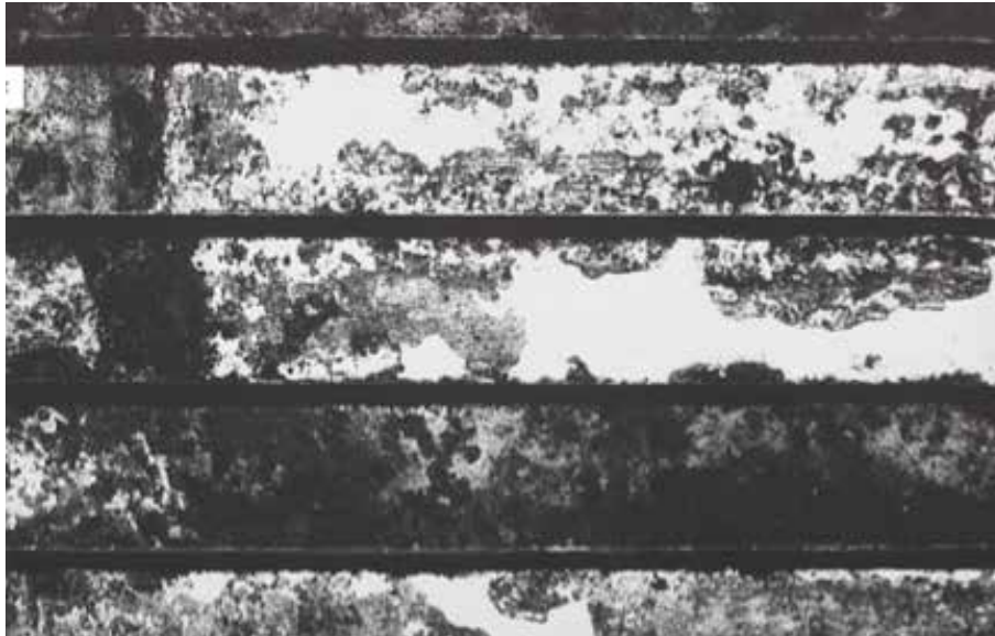
Figura 2. Sin título (1961), Jorge Roiger

Al reivindicar las observaciones de Jacques Aumont (1992) respecto de la reflexión formal de la imagen, tomamos dos cualidades que este autor define en torno a las mismas y que sería posible recuperar de las fotografías de Jorge Roiger. Estas cualidades son, por un lado, la expresividad intrínseca de las formas que aparecen en el registro fotográfico y que por ejemplo en la foto Sin título [Figura 3] correspondería a esa especie de forma orgánica que se genera por el desgaste de la superficie fotografiada.