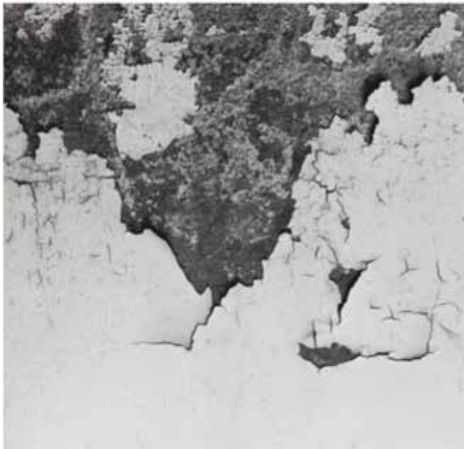
Figura 3. Sin título (1959), Jorge Roiger

Al reivindicar las observaciones de Jacques Aumont (1992) respecto de la reflexión formal de la imagen, tomamos dos cualidades que este autor define en torno a las mismas y que sería posible recuperar de las fotografías de Jorge Roiger. Estas cualidades son, por un lado, la expresividad intrínseca de las formas que aparecen en el registro fotográfico y que por ejemplo en la foto Sin título [Figura 3] correspondería a esa especie de forma orgánica que se genera por el desgaste de la superficie fotografiada.