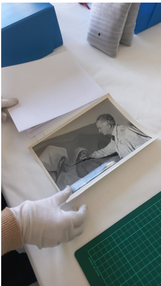
Figura 3. Acciones de conservación de documentos fotográficos del Fondo Ángel Osvaldo Nessi. AyCDIHAAA.

Actualmente las tareas se abocan a la conservación, identificación, descripción y carga de datos de los fondos que posee el AyCDIHAAA al sistema ATOM para el conocimiento y acceso abierto a investigadores y usuarios en general.