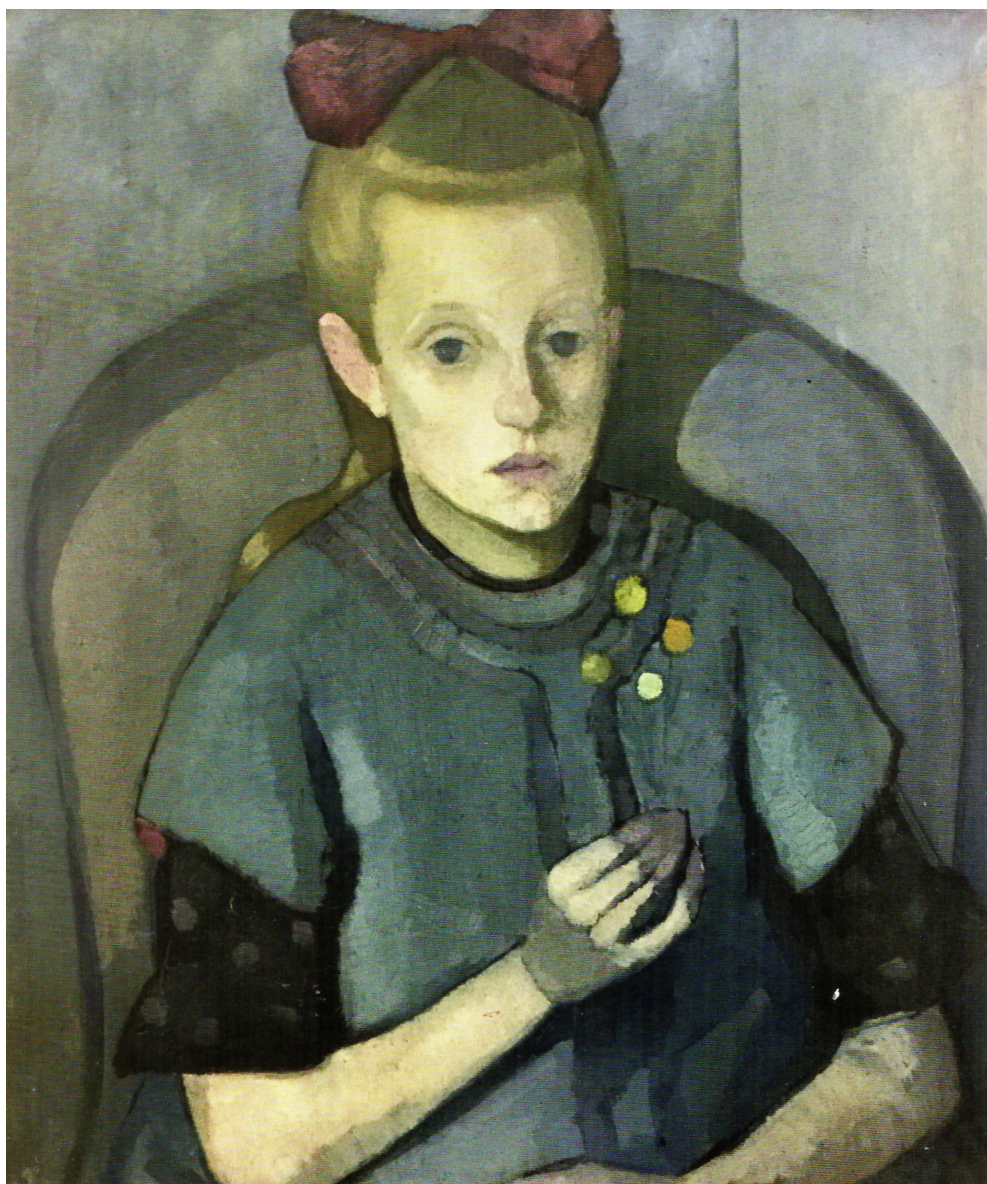
Figura 1. Horacio Butler (1922), Retrato de niña , 65 x 54 cm, óleo s/cartón. Colección particular

Desde el punto de vista formal, la síntesis compositiva de estas pinturas marcó el inicio de un camino que Butler continuaría en París bajo la influencia, sobre todo, de André Lhote. Prueba de ello es que llevó consigo varias de estas obras a la capital francesa, como documentan fotografías de la época. En ellas, la elección de figuras infantiles femeninas —explícitamente vinculadas a la naturaleza— revela una intensa carga simbólica: la niñez como metáfora de lo primigenio y vulnerable, en diálogo con la tradición expresionista que Modersohn-Becker había renovado [Figura 1].