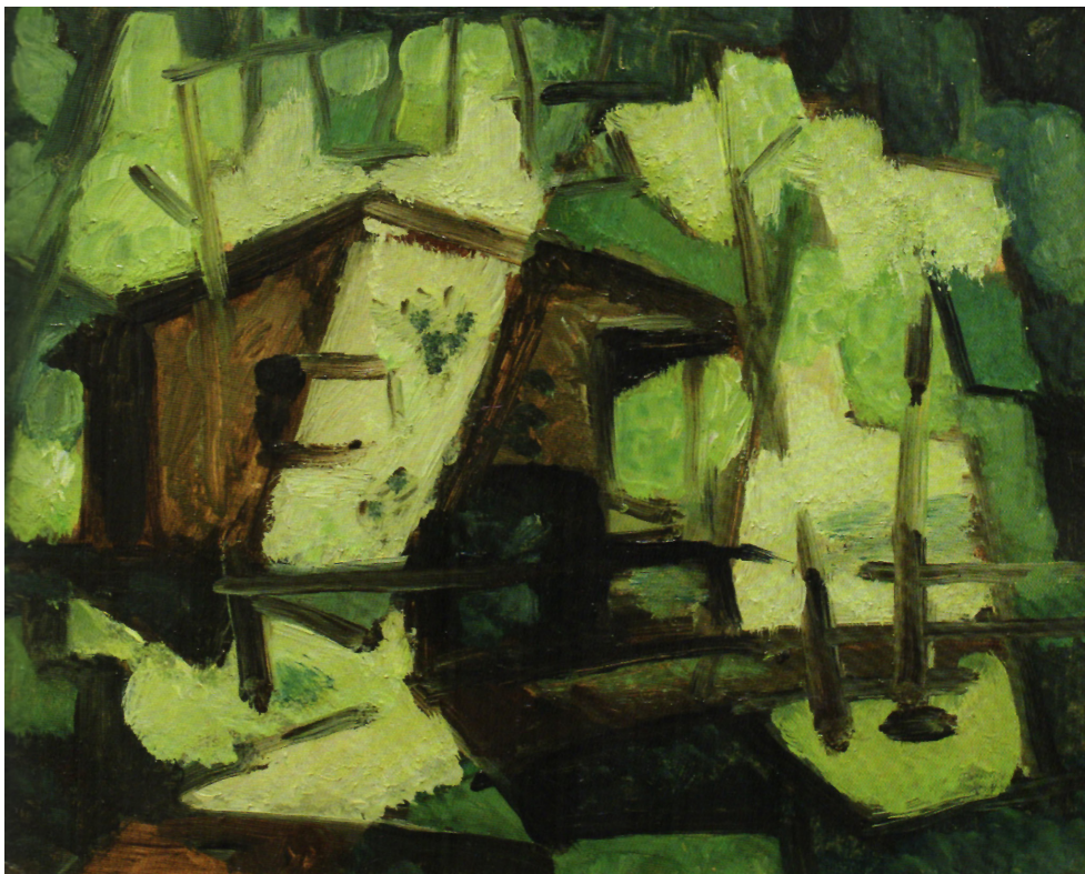
Figura 3. Horacio Butler (1973) Boceto de la casa de Horacio Butler en el Tigre , 16 x 20 cm. (Colección personal, Buenos Aires)

plástica que actualiza un deseo previamente intuido. Refugio, enigma, revelación: despliegan la polisemia de una obsesión recurrente. Sus nuevos trabajos quedan definidos por la combinación de planos lumínicos, junto con una preponderancia de verdes y ocre ya presentes en sus obras juveniles [Figura 3].