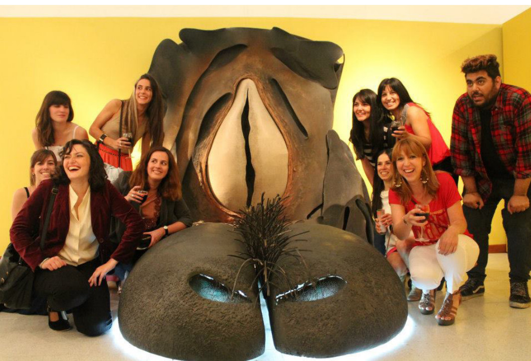
Figura 1. Equipo curatorial de Lo que resuena en el cuerpo . Exposición organizada en el marco del PIPE. 2012