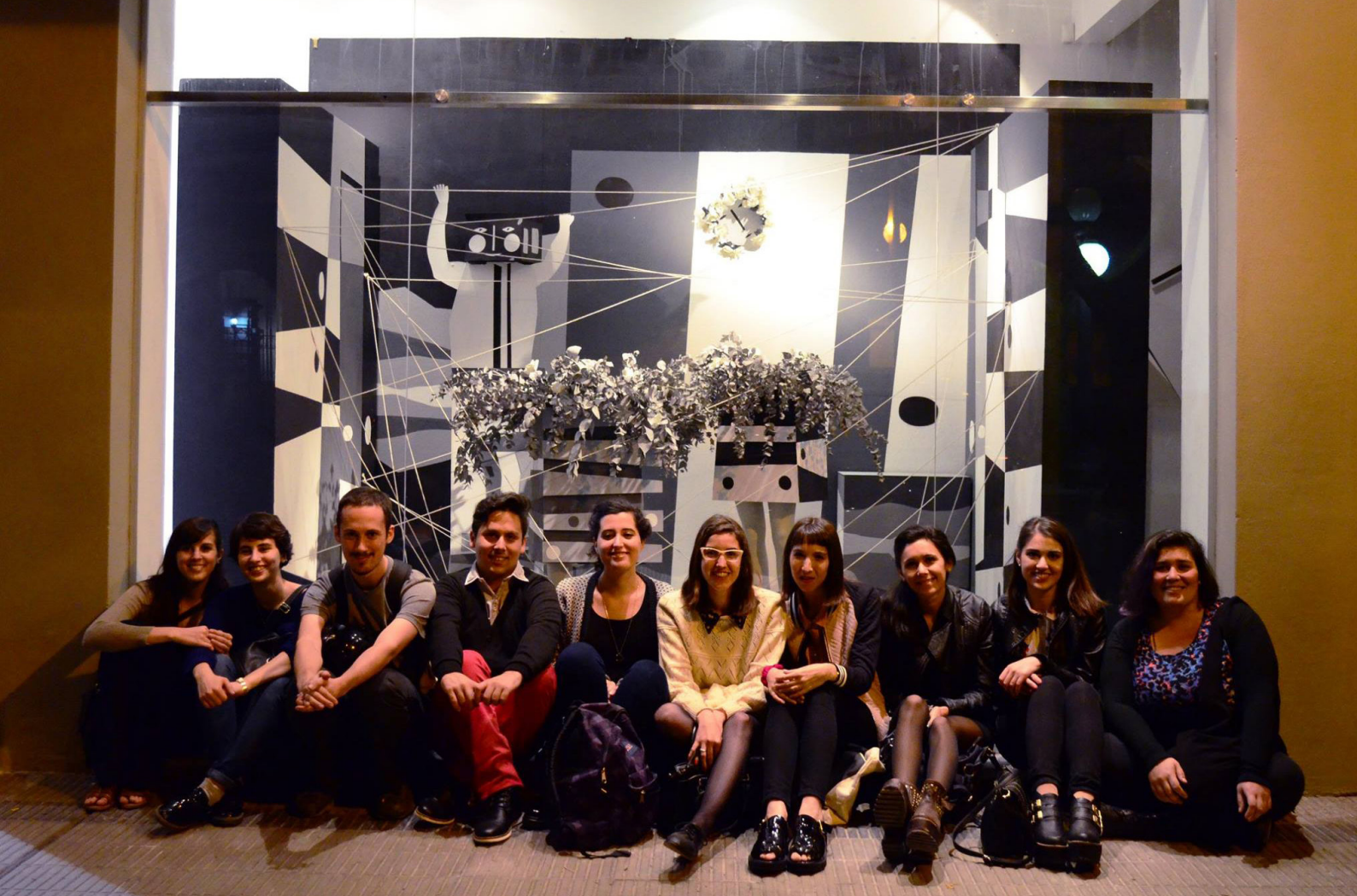
Figura 2. Equipo curatorial de Cuando las formas pulsan. Interferencias en la colección Juan Batlle Planas . Reconstrucción de la vidriera diseñada por el artista para Harrod 's. 2018