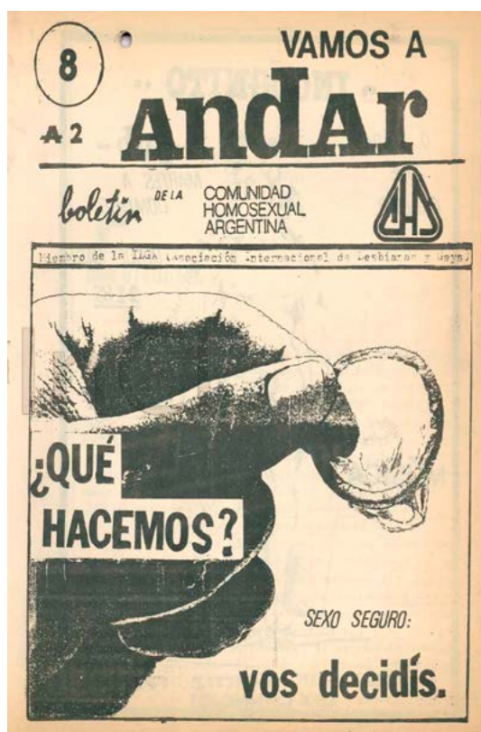
Figura 3. Octava edición de Vamos a Andar , (septiembre 1987). Colección Centro de Documentación e Investigación de la Cultura de Izquierdas.

«¿Qué hacemos?» Se pregunta el título de la octava edición de esta revista, donde se habla de manera colectiva a la hora de combatir esta enfermedad. En el centro de la portada, una ilustración de una mano sosteniendo un preservativo, seguida de la frase «Sexo seguro: vos decidís». En este contexto, los mensajes de fatalismo abundaban, y los mitos urbanos acerca de las potenciales formas de transmisión de VIH, también. Así, los elementos presentes en esta portada funcionan como una respuesta a dicho escenario: buscan plasmar mensajes claros y concisos para el cuidado del cuerpo y las personas. Aquel «¿Qué hacemos?» situado en el título de la portada habla de un yo desde lo plural, desde el equipo que lleva adelante la revista.