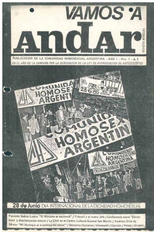
Figura 1. Primera edición de Vamos a Andar , (julio de 1986). Colección Centro de Documentación e Investigación de la Cultura de Izquierdas.

En julio de 1986 se presentó el primer número de Vamos a Andar . Con un montaje de imágenes en el centro, su portada funciona como un testimonio donde convergen las intenciones de esta revista [Figura 1]. Las fotografías presentes tienen como protagonistas a los miembros de la Comunidad Homosexual Argentina, con carteles y pancartas en la Marcha de la Dignidad Homosexual. Debajo, se logra leer el subtítulo: «28 de junio, Día Internacional de la Dignidad Homosexual».