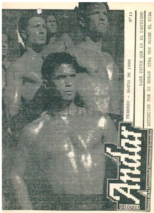
Figura 4. Decimocuarta edición de Vamos a Andar , (marzo de 1990). Colección Centro de Documentación e Investigación de la Cultura de Izquierdas.

tividad «públicamente reivindicable, merecedora de reconocimiento, aceptación y protección» (Halperin, 2012, p. 79). 4