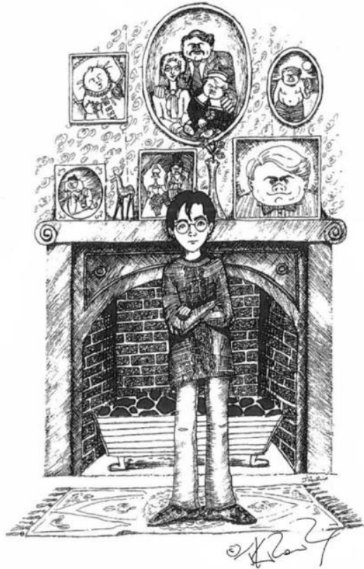
Figura 5. Grupo 1. Harry en PS.

La escritura de Rowling sigue una máxima muy común a los textos policiales y realistas ingleses: show, don't tell , que podríamos traducir como «mostrar en vez de decir» (Gagliardi, 2020). Una y otra vez, el narrador omnisciente de las novelas elige dar acceso al lector por medio de la dimensión visual a las acciones. La narración se concentra en lo que Harry presencia, en cómo percibe al resto de los personajes y los sitios que visita. Estamos ante un caso de focalización donde la visualidad es uno de los mayores indicios para caracterizar a los personajes y entender las situaciones que los involucran. Esta lógica apuesta a que el lector realice inferencias en lugar de que el narrador califique o le ofrezca conclusiones sobre los personajes y la topología. Ese carácter no clausurado en la construcción narrativa y descriptiva aparece en muchos de los dibujos que, como mencionamos, privilegian la interacción entre los personajes y sus actitudes para brindar información sobre los mismos. Show, don't tell se vuelve un principio compositivo que orienta el proyecto creador en ambos tipos de materiales, que ilumina ambos sectores del archivo revelando una coherencia y persistencia entre los estados genéticos.