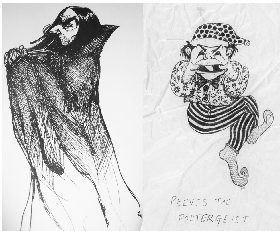
Figura 1. Grupo 1. Diseños de Snape y Peeves. Fuente: Rowling en Pocock (2016)

Los personajes y sus acciones son protagonistas de la mayoría de las composiciones de escenas o en solitario. Son escasos los dibujos individuales que funcionan a modo de cartilla de personaje o referencia [Figura 1].