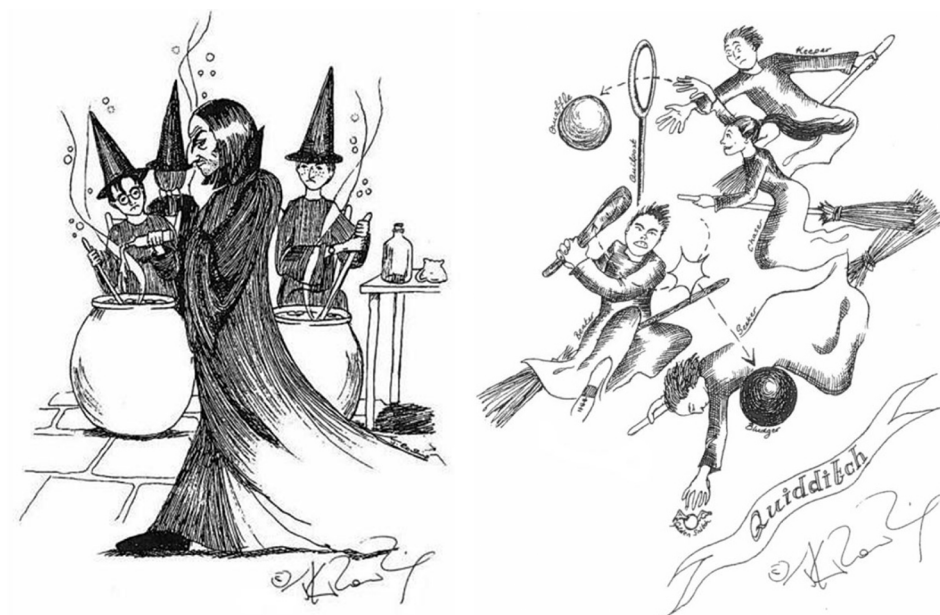
Figura 2. Grupo 1. Clase de Snape y partido de quidditch. Fuente: Rowling en Pocock (2016)

Detectamos un patrón predominante de composición en conjunto, donde se privilegia la acción de los personajes, el movimiento, la actitud, como se ve en la escena del partido de quidditch [Figura 2]. En algunos casos incluso se define a un personaje central en la imagen por contraste con los otros, como se ve en el caso de Snape en primer plano, con actitud desdeñosa frente a los alumnos en segundo plano [Figura 2]. Esta recurrencia compositiva se relaciona con un aspecto de la técnica literaria de Rowling que discutiremos en el siguiente apartado.