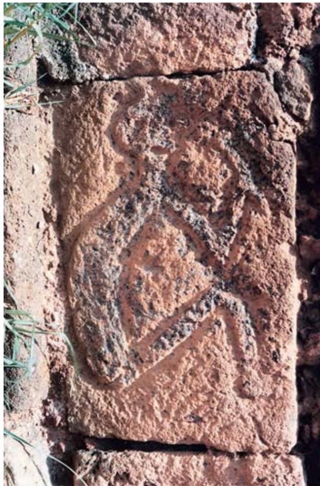
Figura 4. Janamu del Flautista en la capilla del hospital del convento de Santa Ana de Tzintzuntzan.

plateresco y barroco fueron descubiertas 98 piedras con relieves distribuidos en las paredes, siendo difícil distinguirlos entre los demás bloques. Estas piezas sueltas , denominadas janamus en la zona, 3 posiblemente provengan del centro ceremonial por el cual Tzintzuntzan era muy reconocido en la época prehispánica. Uno de aquellos janamus muestra una figura antropomorfa con las piernas flexionadas, sobre sus rodillas se apoyan sus codos y pareciera que en sus manos sostiene un objeto alargado. El personaje tallado, según la investigadora Verónica Hernández Díaz (2012) —quien teorizó sobre los fragmentos encontrados en el exconvento—, puede ser identificado como el flautista , motivo que representa la importancia de los músicos, como exaltadores de lo sagrado, a la hora del ritual.