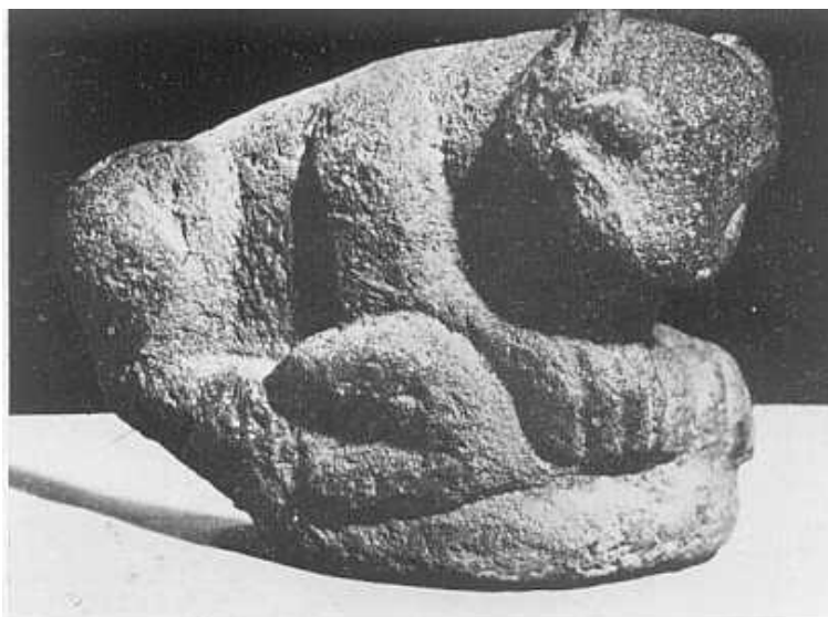
Figura 3. Pieza de piedra volcánica enterrada a los pies de la Iglesia de La Virgen de los Santos Remedios de Cholula.

2 En su rivalidad como opuestos (siendo Quetzalcóatl el Sol Diurno y Tezcatilpoca el Sol Nocturno) también había un dualismo ya que ambos dioses eran hermanos de la pareja celestial y creadora Tonacatecuhtli y Tonacacihuatl.