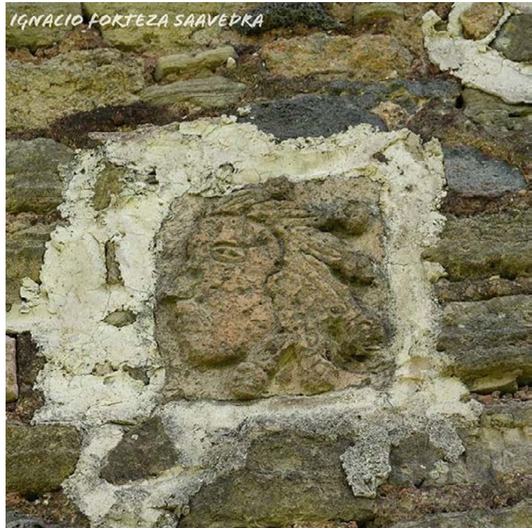
Figura 1. Altorrelieve de andesita en la barda perimetral sur de catedral de San Buenaventura de Cuautitlán. Arqueólogo Ignacio Forteza Saavedra

Una de las piedras talladas del exconvento se ubica en la base de la estructura y muestra una forma circular, aunque la mitad está enterrada [Figura 2]. En ella pueden observarse trazos concéntricos que parten de su centro: triángulos, puntos y guardas. Se cree que pertenece al posclásico tardío (1200-1500 d. C.) por lo que podría asociarse con los grupos nahuas. Su forma circular y los trazos que aparecen alrededor del hueco vinculan a la pieza con una representación astral, posiblemente del Sol. Según el Instituto Nacional de Antropología e Historia (INAH) (2019):