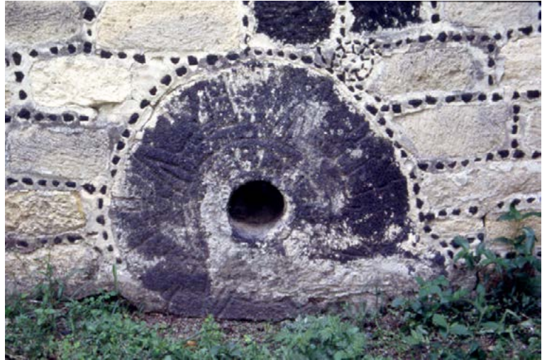
Figura 2. Disco Solar en muro del exconvento de San Martín de Huaquechula.

El tercer ejemplo fue encontrado en el santuario de la Virgen de los Remedios de Cholula. La localidad fue habitada en principio por grupos toltecas, hasta la llegada del español Hernán Cortés, en octubre de 1519. El edificio en cuestión fue construido en 1594 y consagrado en 1666. Ubicado en la cima de una colina, constituye una estructura de tipo barroca republicana en su interior y neoclásica en su exterior. Durante las excavaciones del siglo XX se descubrió bajo la vegetación de la colina —llamada por los nativos Tlachihualtepet , ‘montaña hecha por el hombre’— una pirámide que comenzó a construirse en el 300 a. C. y que posiblemente haya sido abandonada en el siglo VIII d. C.