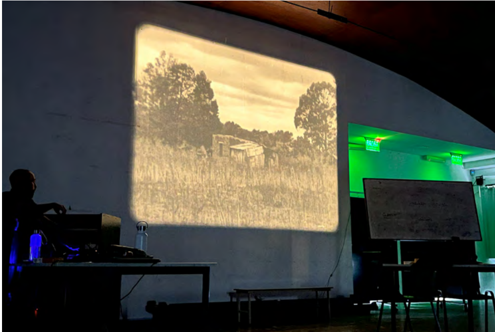
Figura 1. Proyección del cortometraje Escuelas de verano (1970) de Nigri de Sáenz.